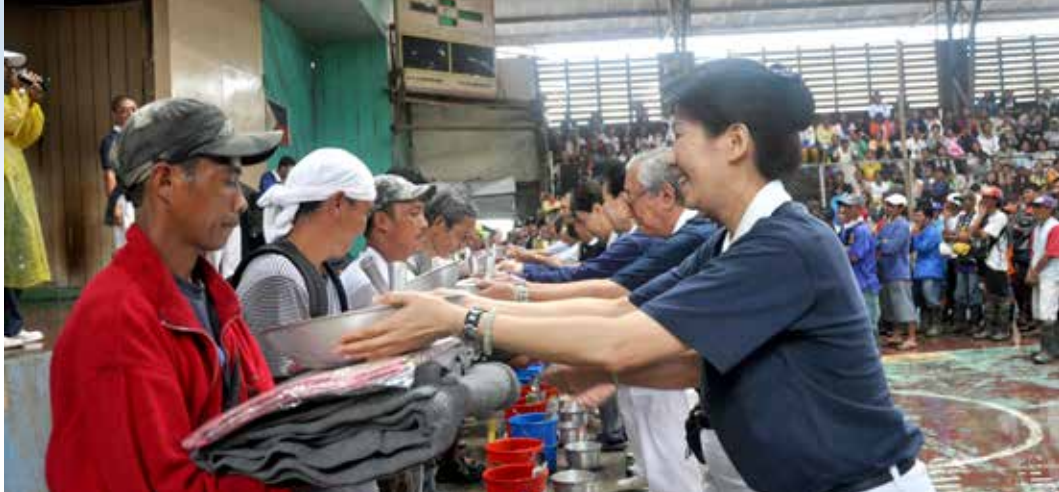
■ 風災過後的義診結合發放，志工恭敬地將十四項物資一一送給災民。

辦法再回去複診，因為我們這裡道路很泥濘，我的腳非常地痛。」醫院距離他住的地方，要耗費兩個小時的車程。倪羅沒有錢坐車，因為原本是農夫的他，田地被風災摧毀，所以無法回去工作。