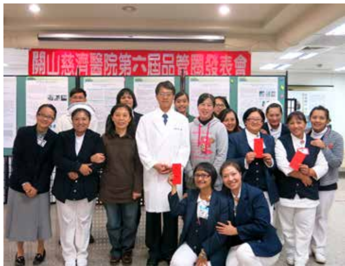
關山慈院為提升醫療品質而自發舉辦的第六屆品管圈發表會，在互相激勵中畫上完美的句點。

車一開始很困難，但熟悉後自然會像反射動作一樣簡單順手，唯有不斷的從經驗中學習，才能讓自己成長，讓醫療品質更進步。