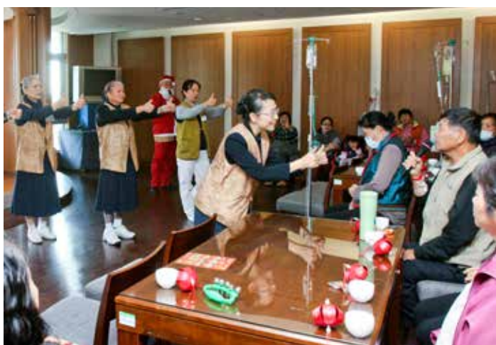
■ 醫療志工帶動唱、獻祝福，病患也拿起麥克風跟著歌曲獻唱同樂。