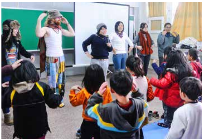
年輕醫師群帶動團康活動，邀請小朋友們一同活動筋骨。

一日的山中奇緣在歡笑聲中結束，小朋友們帶著笑靨揮手再見，這群年輕的醫師哥哥和姊姊也帶著滿滿的感動下山。（文／謝明芳）