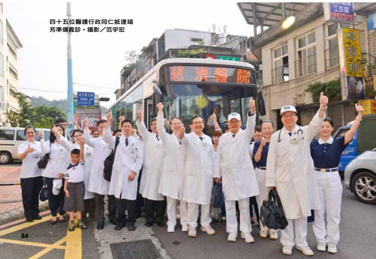
四十五位醫護行政同仁抵達瑞芳準備義診。

廿二日清晨六點半，四十五位醫護同仁已整裝待發，從新店搭車前往義診地點，而瑞芳國小的活動中心也湧進許多等待看診的民眾。顧念許多無法出門就醫的患者，此次瑞芳義診特別規劃了五條往診路線，走進一條條狹窄蜿蜒的巷弄，將醫療服務帶到病患家中。