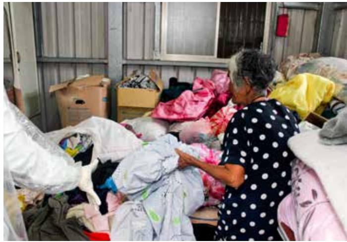
阿嬤房間內堆滿雜物，完全看不見被埋沒在底下的床鋪。