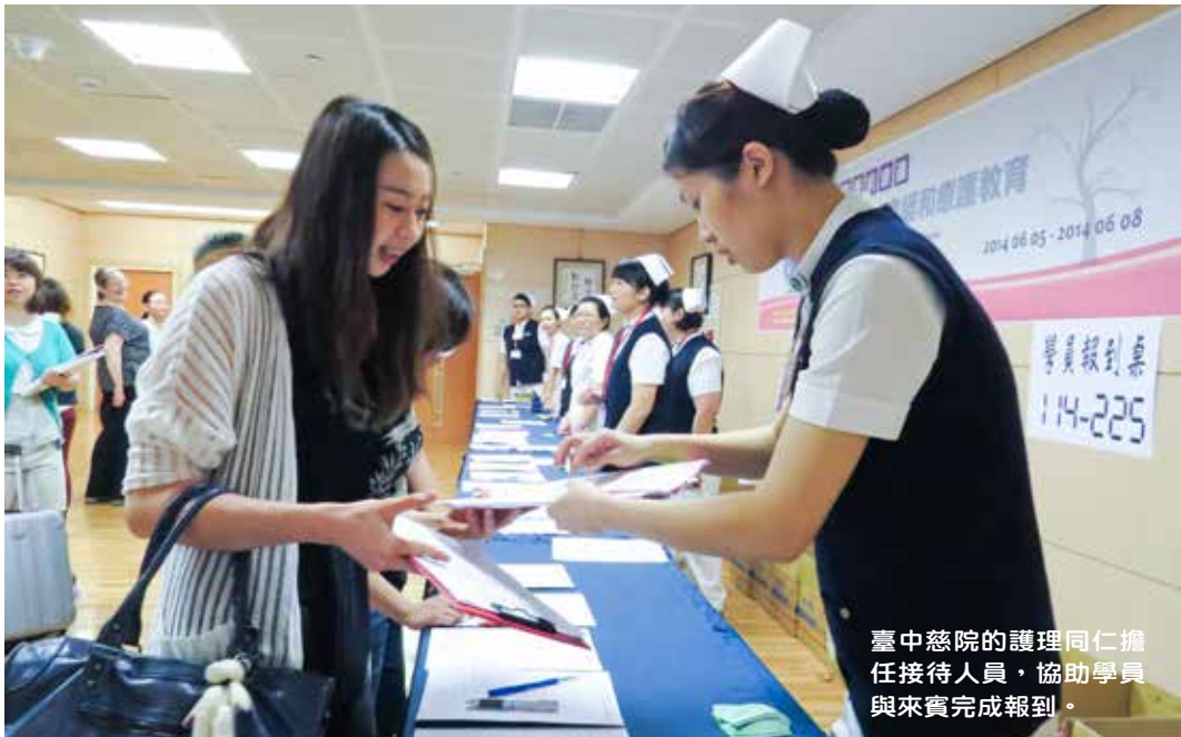
臺中慈院的護理同仁擔任接待人員，協助學員與來賓完成報到。

六月五日的會前研討會，由澳洲醫師威爾金森 (Wilkinson) 分享「國際兒童及新生兒緩和療護趨勢」、「瀕臨死亡兒童相關之決策」、「瀕臨死亡