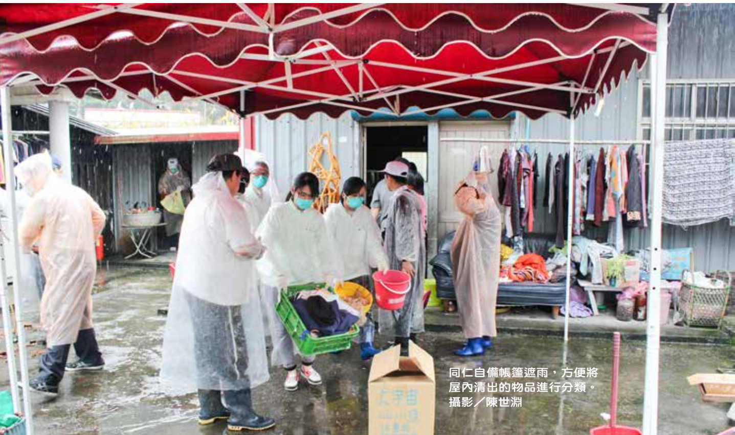
同仁自備帳篷遮雨，方便將屋內清出的物品進行分類。