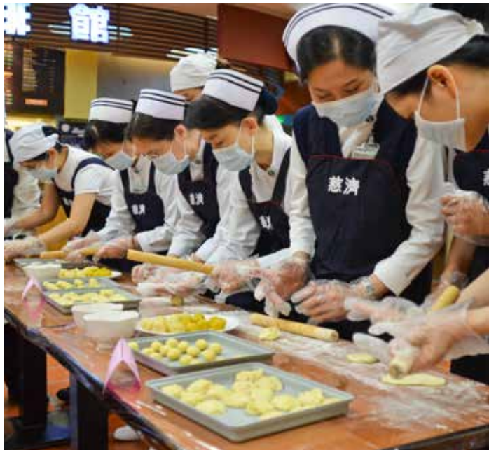
臺北慈院同仁親手製作月餅到裝盒，只為將誠摯祝福送到受災社區。