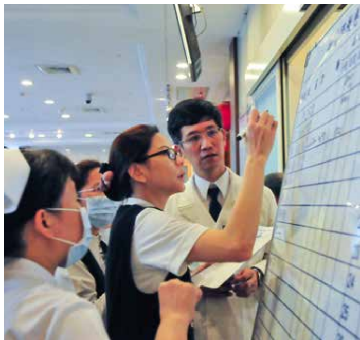
臺北慈濟醫院急診室醫護人員全員待命，搶救傷患。

八月十七日周日上午九點三十分，新北市朱立倫市長、衛生局林雪蓉局長在趙院長及黃思誠副院長的陪同下，再到病房探視傷患。賴太太提到氣爆事件時，依舊面露驚恐；爆炸的巨響也影響到她的聽力，醫檢師在為她進行聽力測試時，她一聽到類似救護車的鳴笛聲，便會驚慌大叫。趙院長十分關心她的身心恢復狀況，也指示身心科醫師前來會