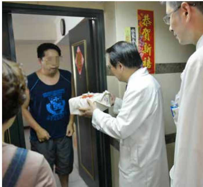
臺北慈濟醫院醫療團隊與志工走入氣爆受災社區，並將象徵愛的安心福富足月餅送至他們手中。

要回憶起當時氣爆情境，神情就顯得不安，似乎驚魂未定。也有人聽到消防車的聲音就趕緊抓住路人、或是常常晚上做惡夢，甚至害怕到不敢再搭電梯。所以今天特別安排多位身心醫學科醫師、護理人員等，希望能傾聽膚慰住戶的心聲，並在團圓佳節前夕，親手送上上人人與臺北慈院全體同仁的祝福。」