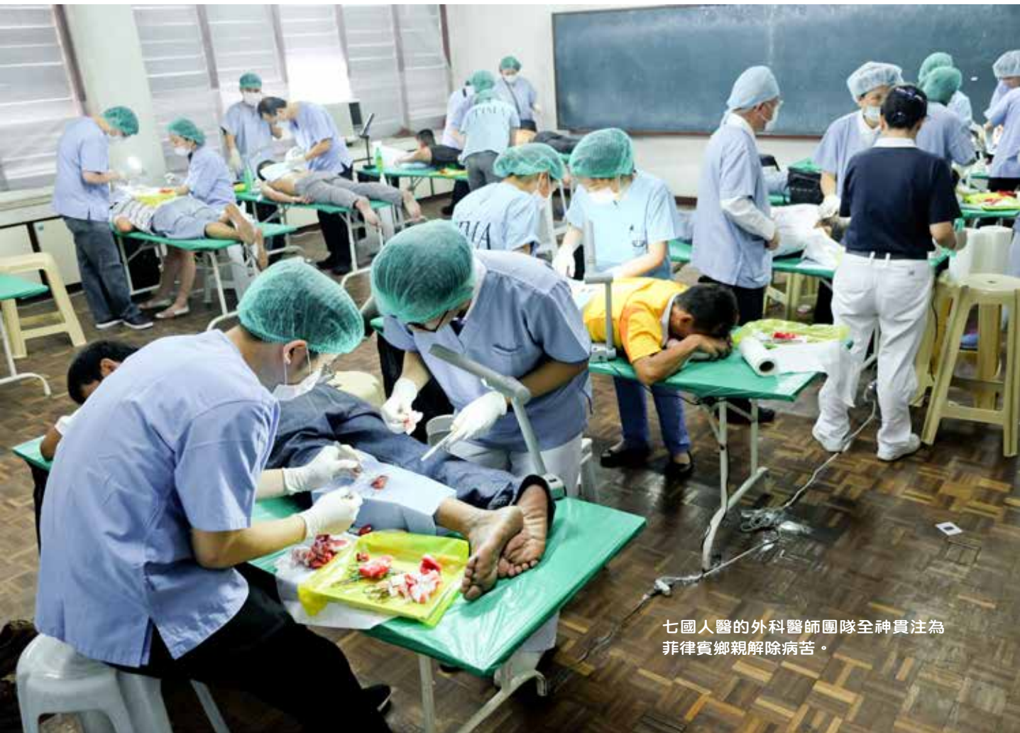
七國人醫的外科醫師團隊全神貫注為菲律賓鄉親解除痛苦。