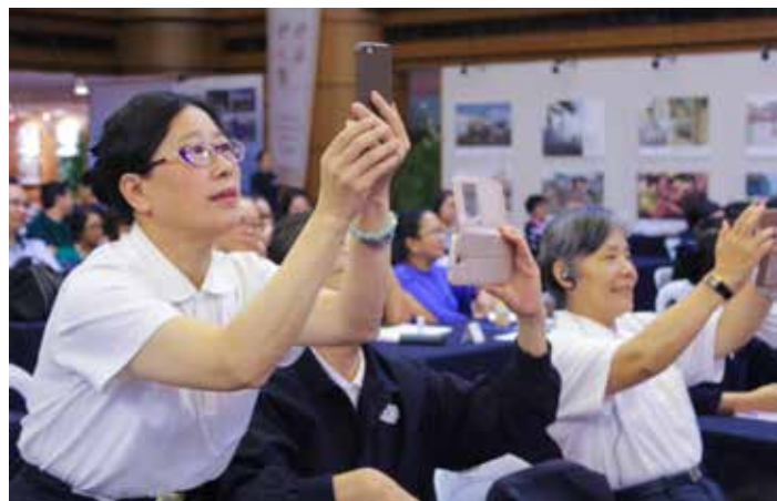
充實的人醫論壇課程，學員認真記錄。