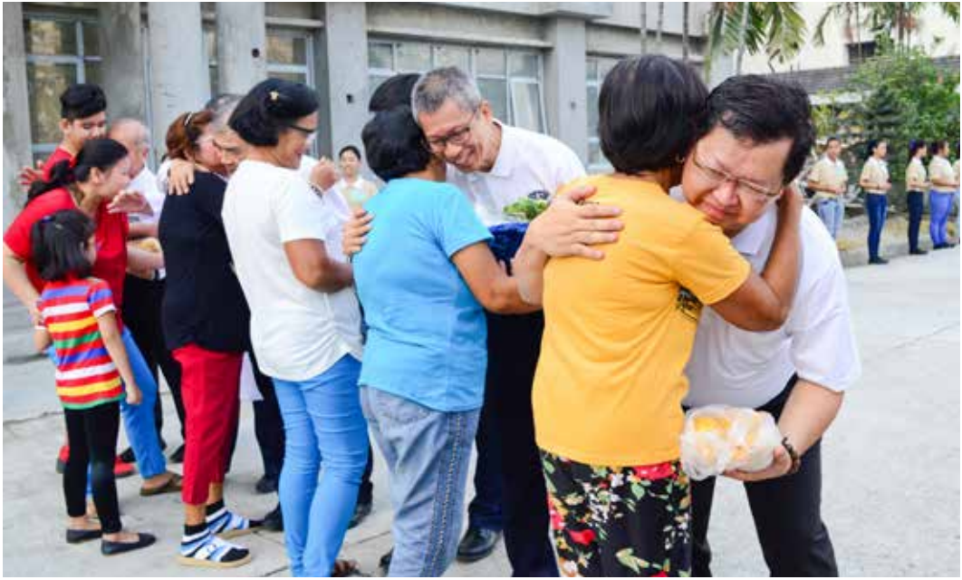
三月七日，曾經接受眼科治療的病人帶著蔬果土產前來答謝與祝福。