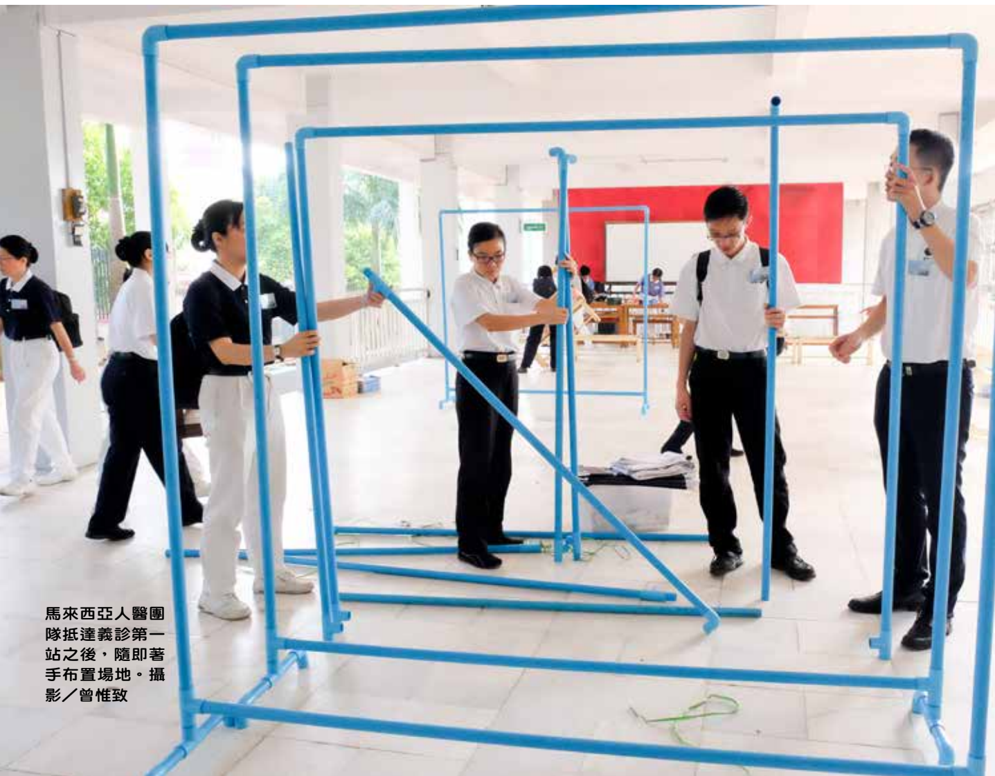
馬來西亞人醫團隊抵達義診第一站之後，隨即著手布置場地。

義診前一天，九月三十日，馬來西亞團隊一行人甫抵達緬甸仰光機場，立刻又風塵僕僕地前往義診的第一站岱枝鎮(Taikkyi Township)，開始進行場地布置。團隊成員中不乏來自馬來西亞各大醫療院所的名醫，他們來到會場、放下身段，著手清理場地、搬運物品、設置動線，人人不留餘力，希望給患者舒適乾淨的義診空間。而在