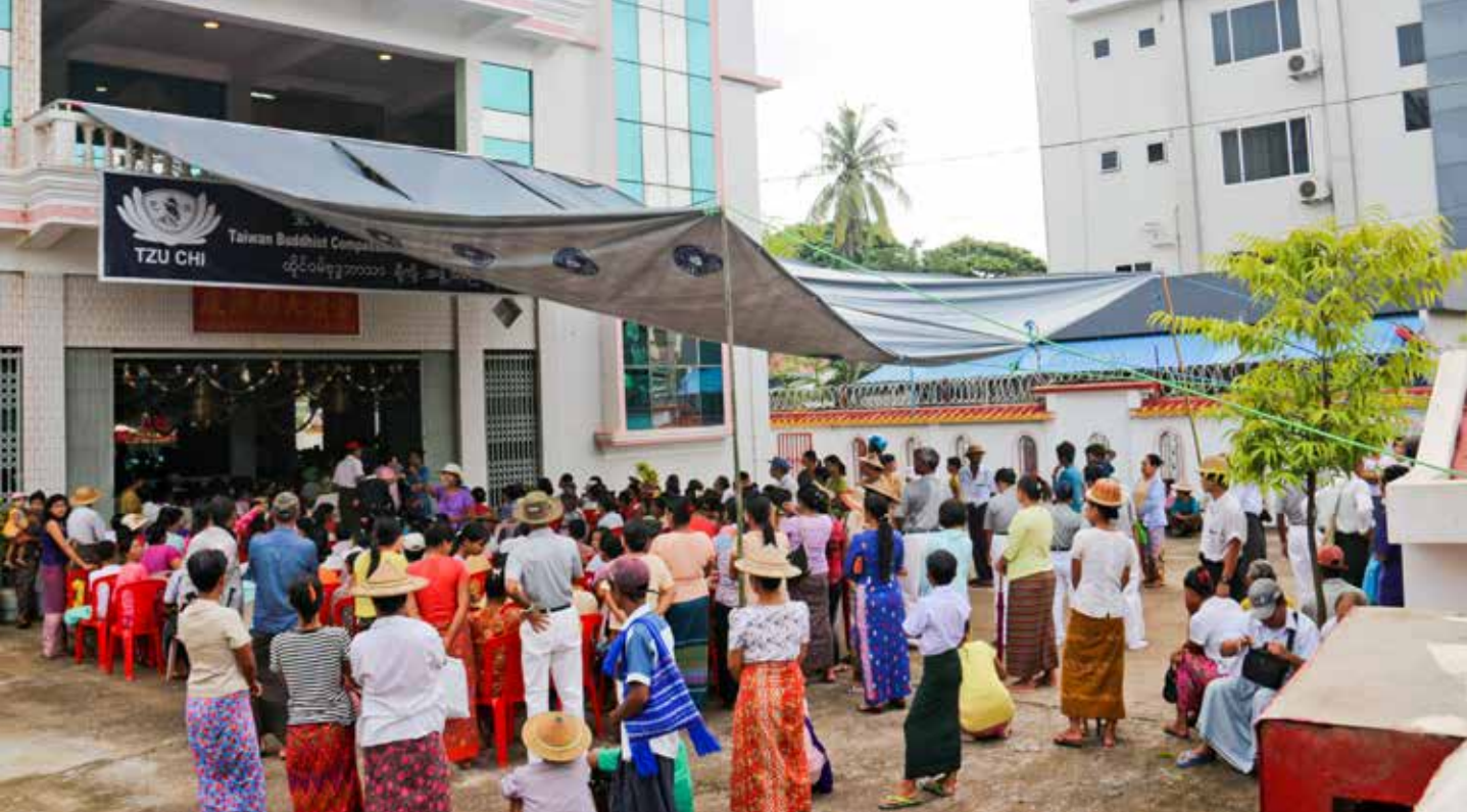
近千名岱枝鎮鄉親前來求診，人潮延伸至宗親會大禮堂之外。

義診前兩天，緬甸慈濟志工和岱枝鎮的農民們就已利用當地的材料，為各科門診裝設隔間。