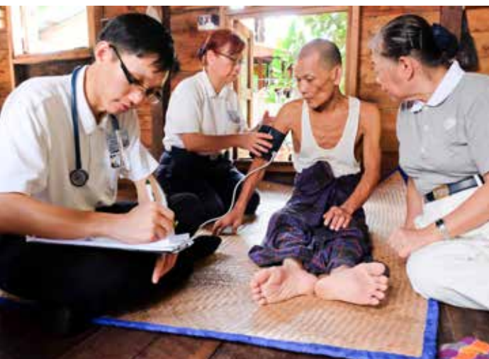
除了定點義診，醫護人員與志工也前往居民家中進行往診。