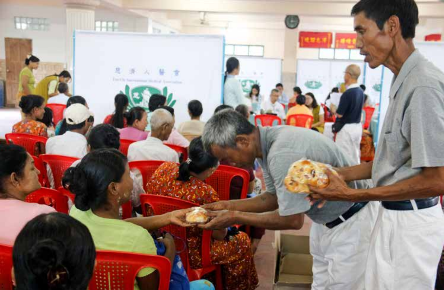
擔心遠道而來的鄉親候診過久，志工恭敬地送上麵包請他們享用。

裡，寺裡的硬體設施比起早年已經提升很多，但仍可發現孩子們之間普遍罹患的皮膚病。寺廟學校內的孩子多數因為家境貧困，經常三餐不繼，長期下來易發生營養不良的情況。