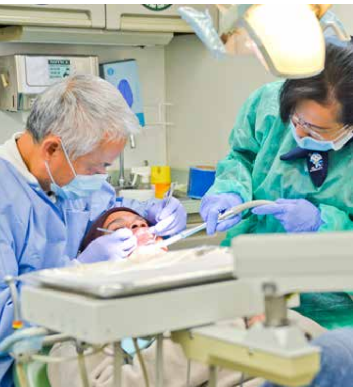
牙醫師在大愛巡迴醫療車上為病患治療牙齒。

加州佛雷斯諾(Fresno)及南加州愛滿地(El Monte)，共六十組的手提式牙科治療器和診療椅，並出動一輛牙科大愛巡迴醫療車，為求診的民眾洗牙、拔牙、治療牙根，在現場即時配製假牙。