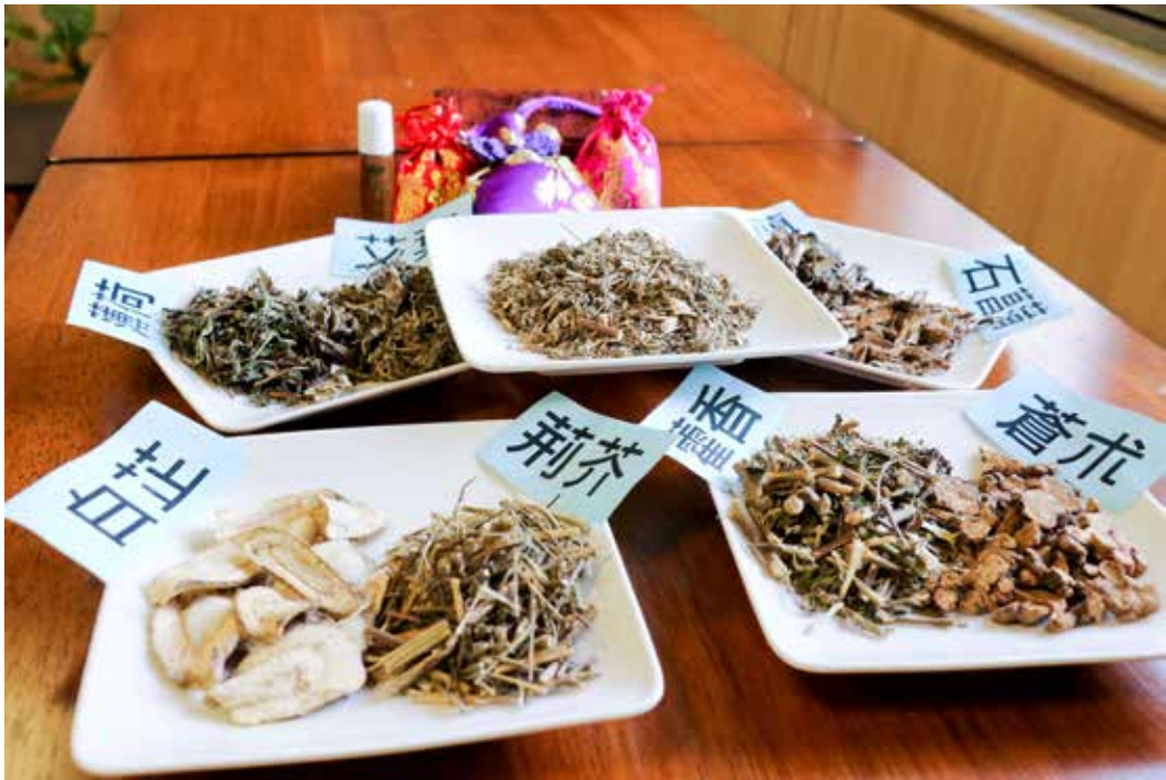
登革熱疫情北移，臺中慈院透過中藥成分的防蚊包與寬心油，呼籲民眾預防蚊蟲叮咬、避免感染。