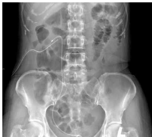
寶貝女士治療前後的X光攝影圖。左圖為手術前，可見右側腎臟的鹿角結石；右圖為手術後，顯見結石全部消失。