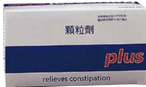
▲增加糞便成型藥物

◆ 高滲透性緩瀉藥 ，如Lactulose Liquid（杜化液），它不被人體吸收，透過細菌分解後釋放有機酸在結腸起作用。尤其適宜於老年人、孕產婦、兒童及術後便秘者。糖尿病病人慎用。此類藥的主要缺點是在細菌作用下發酵產生氣體，引起腹脹等不適感。