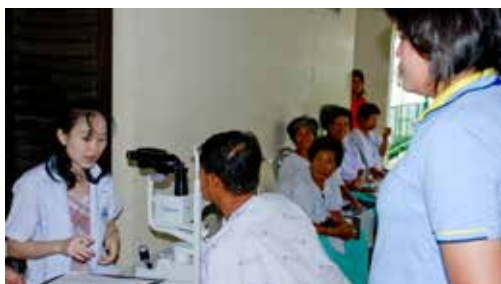
■ 泰國人醫會已經完成兩萬六千例白內障手術。圖為醫護人員協助術後病人下床坐輪椅。且出院之前，眼科醫師一定會再次仔細檢查。