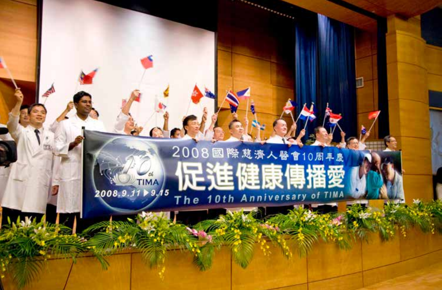
■ 十八個國家的慈濟人醫會代表進場，國旗繽紛飄揚，二〇〇八年國際慈濟人醫會正式展開。