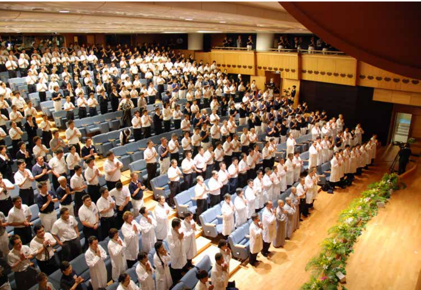
■ 人醫年會學員虔誠祈禱，願天下無災無難，人人平安。

全球趨勢選定一探討主題，去年是『醫療與環保』，今年的主題則因應現今社會對於疾病預防的重視，強調健康促進。」他並分享自己當人醫會志工最歡喜的事，一是可以幫助很多人，二是看到受助者起身助人的付出，希望可以影響更多年輕人一同加入。