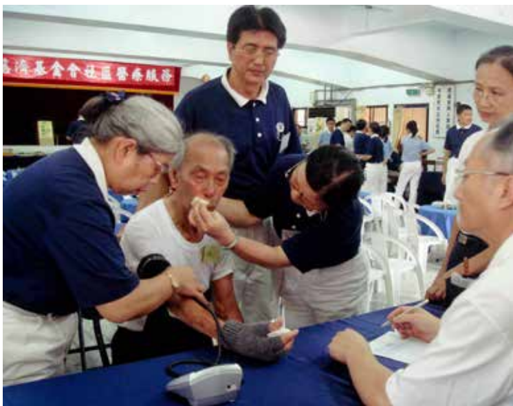
■ 在義診時，人醫會志工也成為老人家傾吐心情的對象。圖為台北縣石門鄉一位九十幾歲老農民哭訴著一身病痛，令人不忍。

高屏區人醫會主要服務區域以高雄和屏東為主。經過多年的努力，目前團隊成員九百八十一人。除了偏遠地區的定期義診外，從二〇〇四年起開始舉辦社區衛教，深入偏遠山區及部落，針對民眾常見的健康問題，如：痛風、關節