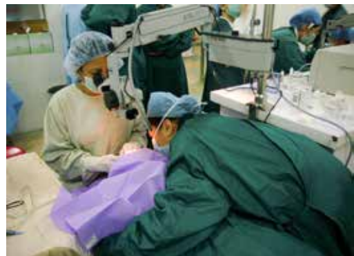
■ 菲律賓人醫會不僅於國內定期義診，也會參與國外的賑災義診活動。圖為菲律賓慈濟人醫會醫師赴大陸為白內障病患動手術一景。