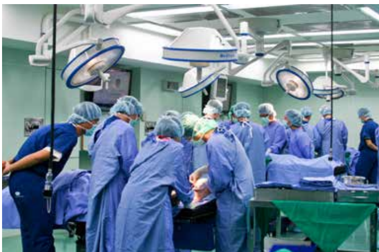
■ 難得的模擬手術課程，學員們個個凝神專注地練習。