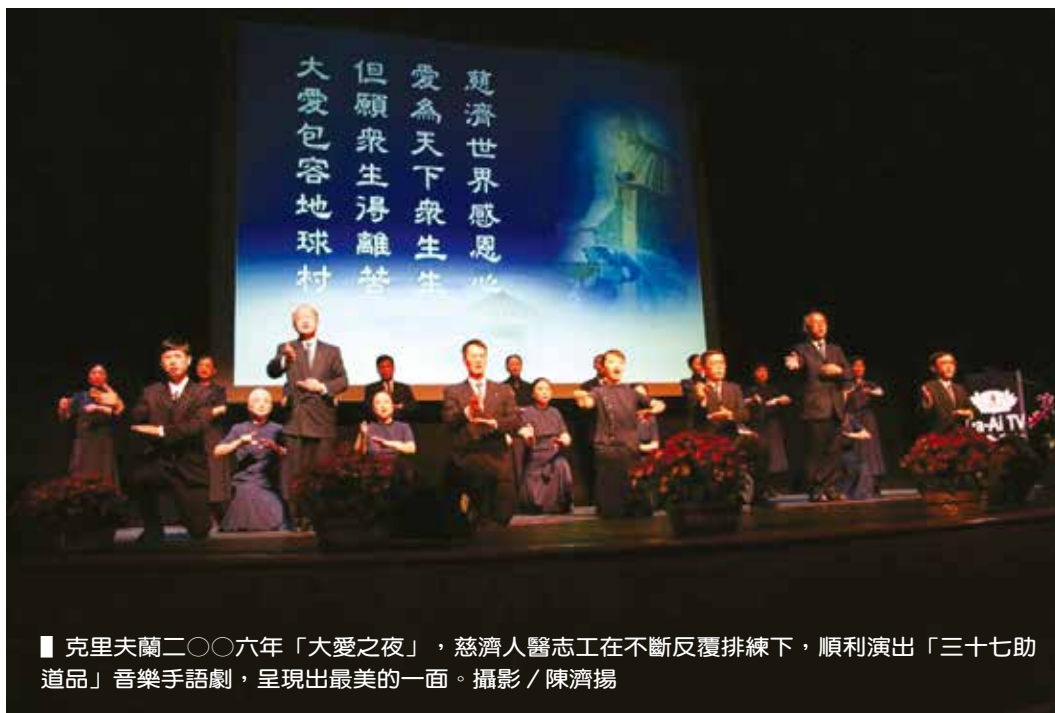
■ 克里夫蘭二〇〇六年「大愛之夜」，慈濟人醫志工在不斷反覆排練下，順利演出「三十七助道品」音樂手語劇，呈現出最美的一面。