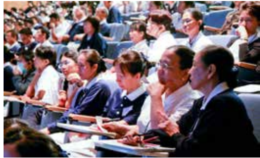
藉由觀摩模擬手術課程，人醫會成員們有的複習、有的練習，彼此交換心得。

在病人身上動刀不能劃下太大傷口，以致於住院醫師與醫學生常因為開刀傷口範圍太小，無法看仔細內部結構。透過大體模擬手術就可以避免，擔心傷口太大、時間太長與流血的問題。例行手術很多看不到的重要部位，可能就在病灶周圍，而那些常是不可以去碰觸的地方，否則就有可能引發併發症或是不可挽回的問題出現。