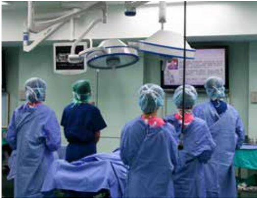
■ 在模擬手術課程動刀之前，老師與學員們謹記大體老師生前的叮嚀。

模擬醫學中心訓練設施仿照醫院開刀房的規劃，手術教學室設有八個手術檯，配備全套附屬設備、獨立的手術燈組、醫療等級監視器、大型人文互動液晶螢幕、四套內視鏡手術儀器組、四套顯微手術儀器，及各類科手術器械組等。