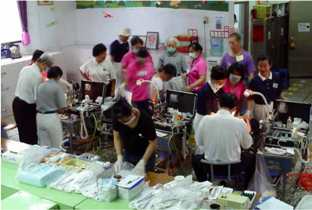
■ 教養院、啟智院童的口腔保健也是近年來臺灣人醫會義診重點。圖為人醫會到帶了三台看牙診療椅與器材，為院生洗牙看牙。攝影 / 蕭志中

炎、高血壓及糖尿病等特別宣導，也設計衛教海報張貼，獲得社區高度肯定。除此之外，精益求精的志工們將印尼人醫會所贈的鐵架改裝成爲活動衛教看板，以及兼顧隱私的診間隔間架，完成組裝只需要短短二十分鐘，用心的程度令人讚嘆。