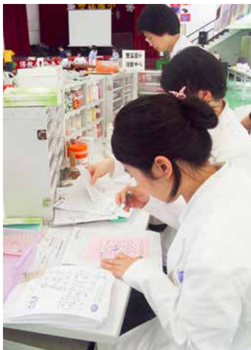
■ 行動藥局就地設立，應有盡有，義診藥師忙碌不已。

是有健保照顧不到的地方。雙溪這一帶的確因為交通不方便，鄉民看病不易，小病拖久了變大病。」趙院長說，義診