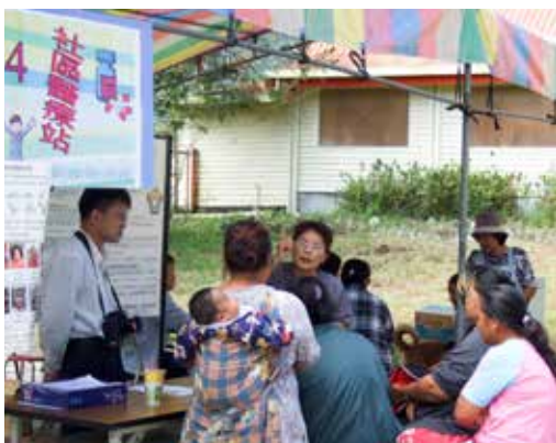
■ 社區醫療站是衛教活動其中一道關卡，由受過訓練的居民擔任管理員，協助解決居民的病痛。

發，佈置場地，就是希望山區的居民不因山高水長而影響接受健康促進衛教活動之權利，期待將美好的一天帶給所有利稻與霧鹿村民。因部份民眾必須忙於耕作高山蔬菜，無法即時趕回參加，但仍有二十多公里外霧鹿村村民前來，與利稻村民眾合組隊伍，共計有九十人參與。