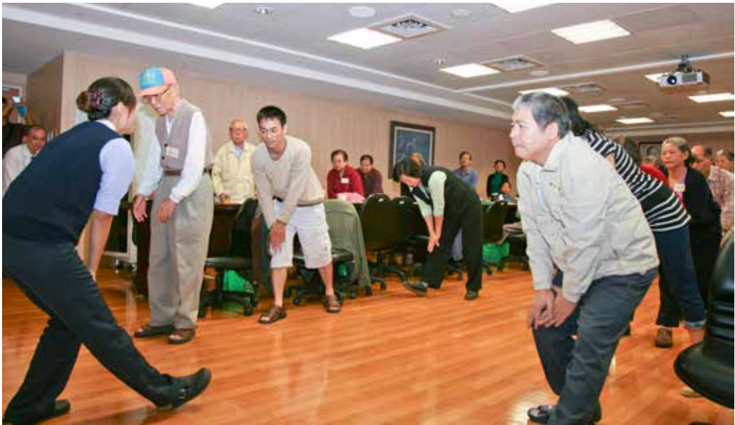
■ 臺中慈院社區健康中心帶著參與講座的巴金森病友活動筋骨，並一併教會他們預防身體僵硬的技巧。