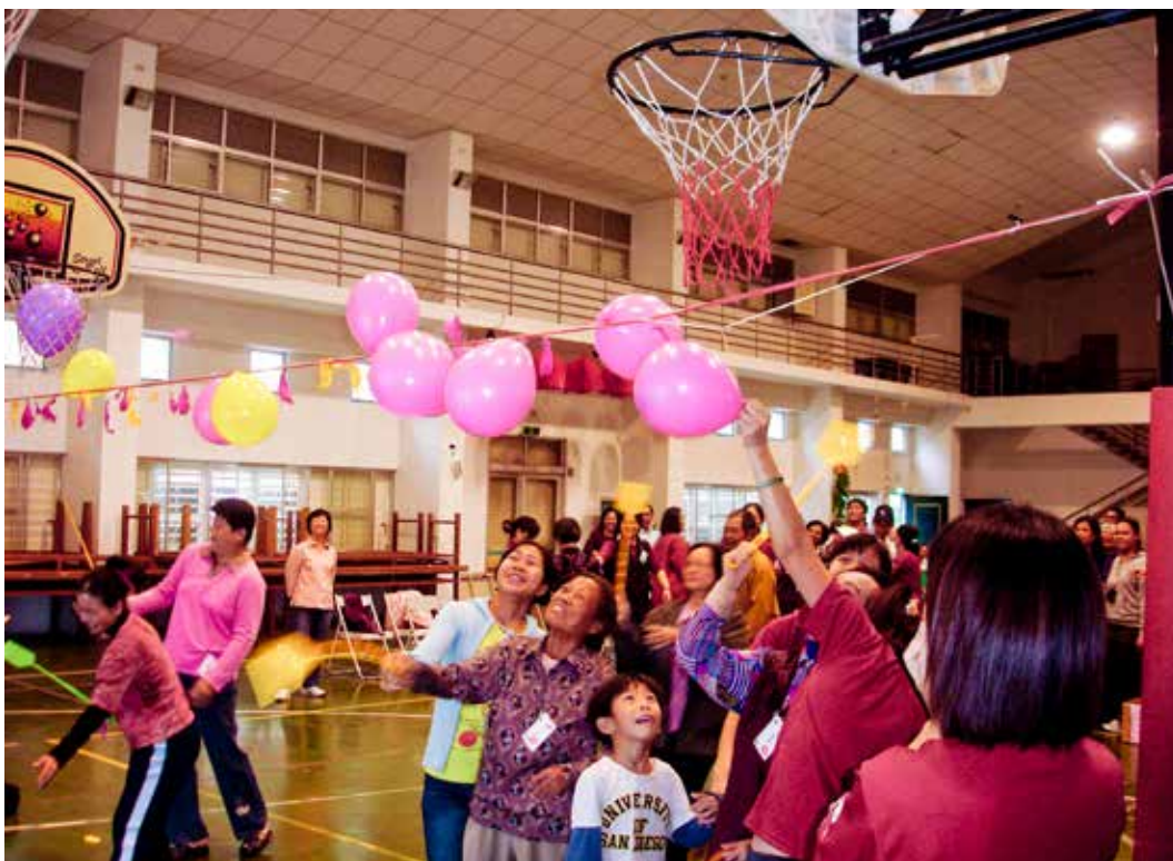
■ 用球拍打氣球的活動深受病友和家屬的喜愛，氣球內會有一張寫上食物名稱的小紙條，讓病友與家屬分辨應屬於高磷或高鉀。

任趁機告訴大家「高血壓」的正確知識，請病友們注意，一旦血壓達到收縮壓一百四十毫米汞柱、舒張壓九十毫米汞柱就表示可能需要注意，但不要太緊張，要連測三次都偏高，才能代表有問題。起初可先用飲食控制，少油少鹽以改變生活習慣。現場準備有獎徵答，讓在這也能深入了解健康的重要。