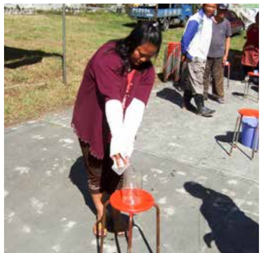
■ 參加闖關的居民雙手被夾上木板綁上繃帶後倒水，體驗痛風行動不便的痛苦。

今年的衛教活動在南橫公路上海拔一千零六十八公尺的利稻村舉行，十四日一早，清晨五點半工作即從關山出