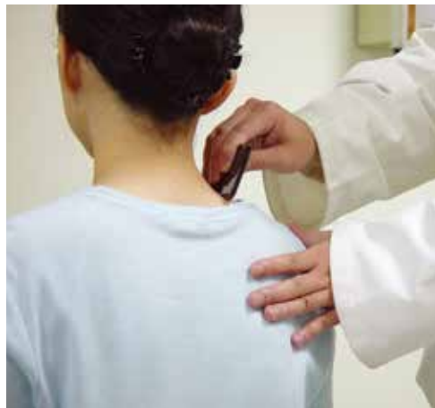
兩側肩膀由內往外刮