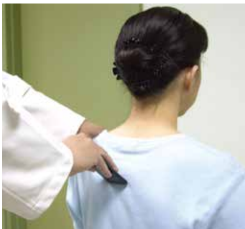
脊椎兩旁肌肉處由上往下刮