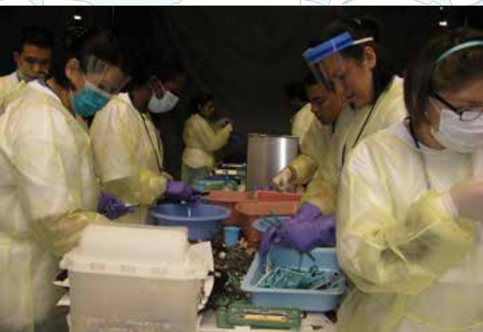
■ 美國職業專校的牙科助理班十幾位學生來幫忙清洗和消毒牙科器械。

思頓感覺手掌竟然可以半打開了。他非常感恩醫師的治療，也希望將來能夠在中醫的協助下恢復正常，然後找到一個好工作。