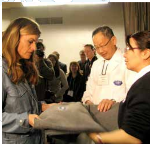
■ 加州州長夫人瑪莉亞史瓦辛格來到現場關懷RAM的義診活動，曾慈慧師姊特別向她介紹慈濟的環保毛毯。攝影 / 楊婉娟

豪地對我們說：「我有環保杯！」希望這次的水杯運動能夠起帶動作用，讓來參加的志工及病人都一起愛地球。