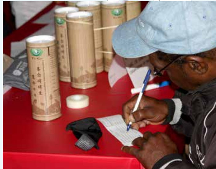
■ 聽到竹筒歲月的故事後，來看診的民眾立即認養竹筒。