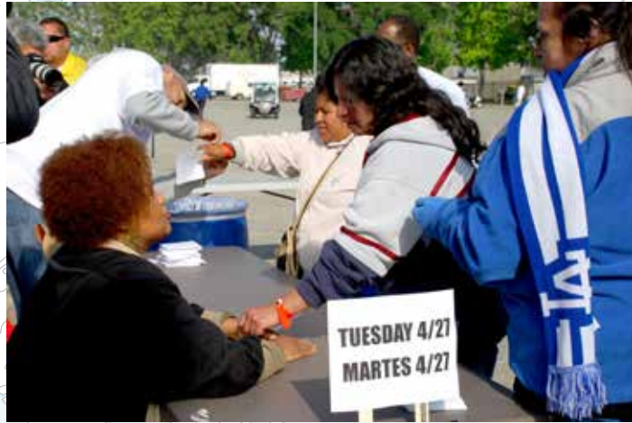
■ 偏遠地區醫療團隊決定在義診前兩天依據看診日發放不同顏色腕套，讓民眾不用漏夜排隊候診。

為了避免居民們半夜帶著棉被或毯子忍著冷風露宿街頭，在球場外等待拿號碼，偏遠地區醫療團隊決定在義診的前兩天，二十五日，先開始發腕套，到時候可依不同顏色代表不同日期、時段來進場看病，每個看診日都準備了一千二百個號碼