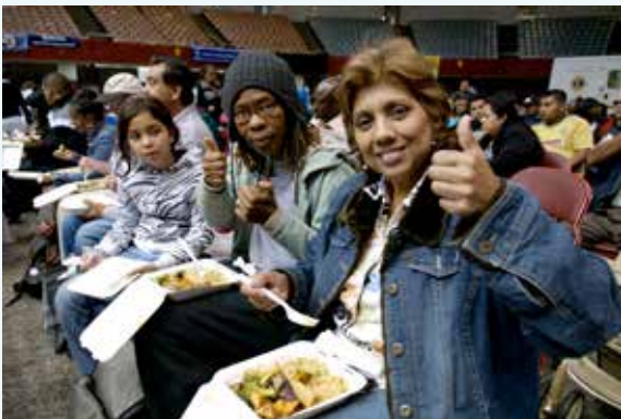
■ 病患豎起大姆指稱讚。