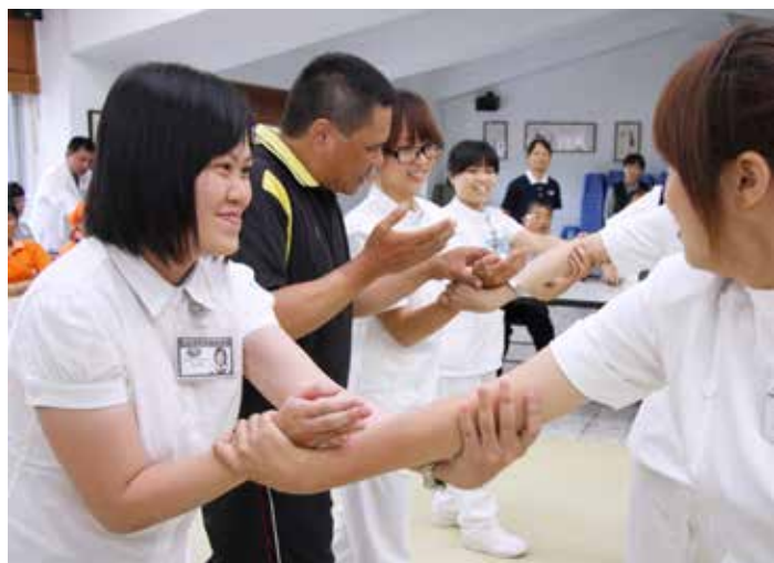
■ 護理同仁親身下場演練，實際運用脫逃小技巧後發現並不難。

雖然因為醫病溝通未盡完善而引起的糾紛或肢體衝突時有所聞，但醫院是搶救生命、守護生命的地方，醫護人員在