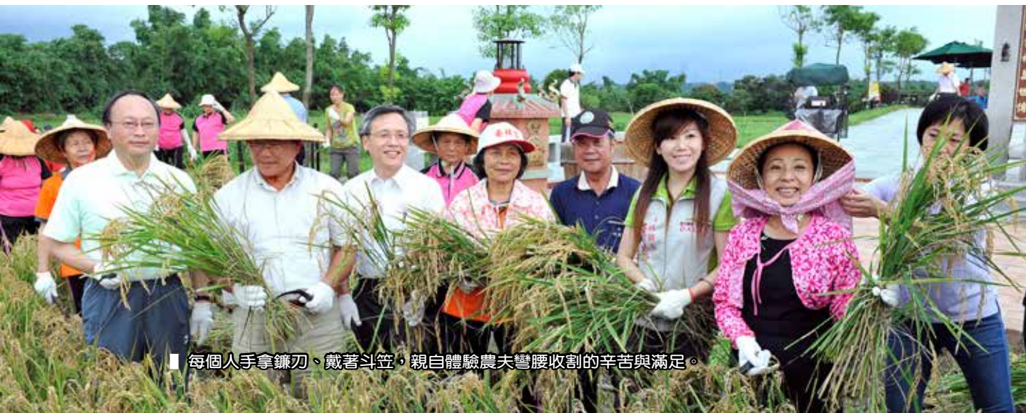
■ 每個人手拿鎌刀、戴著斗笠，親自體驗農夫彎腰收割的辛苦與滿足。

這一期稻作的收穫，除了捐贈縣府的部分之外，也將做為歲末祝福紅包中的稻穀，製作過程十分複雜，簡院長說，同仁和師兄姊在製作的過程中，可以讓自己學著把心沉澱下來，去領會一顆顆飽滿稻穗的美，就如證嚴上人所說「一粒米中藏歲月」的精神。（文／黃小娟）