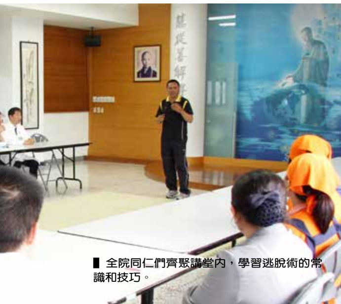
■ 全院同仁們齊聚講堂內，學習逃脫術的常識和技巧。

了解突發事件的對應方式後，因而減少不必要的恐慌，更能心無旁鶩的投入照顧病患的工作，深入了解病患需求，醫療品質不但不打折，醫病關係也能更和諧。(文、攝影 / 陳世淵)