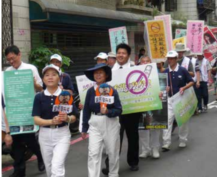
■ 臺北慈院同仁及志工手拿標語牌，並沿街呼喊拒菸口號，希望將無菸環境的觀念帶給民衆。