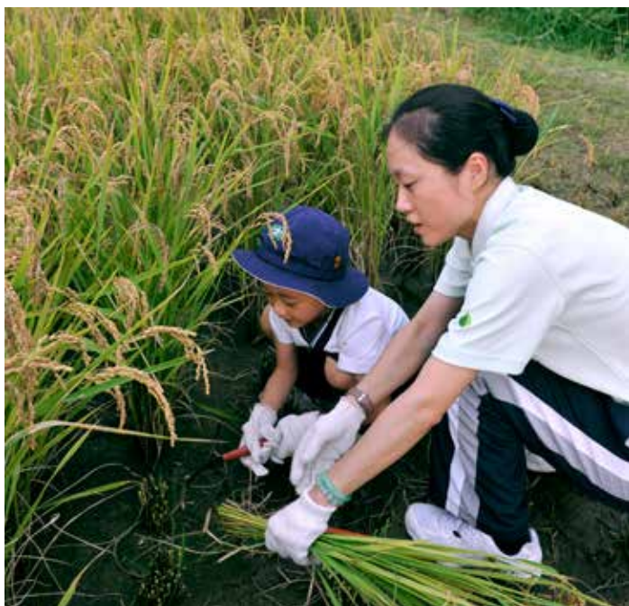
■ 下圖：第一期大愛健康米熟成，大林慈院和媽媽一起來的小朋友，彼此分工合作、樂在其中。