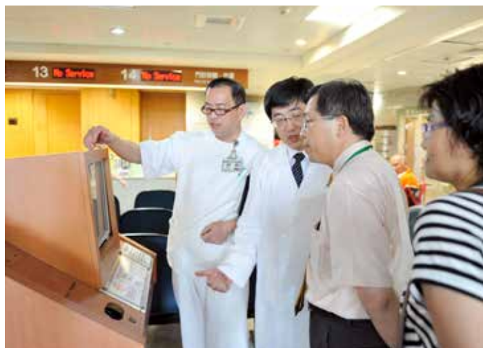
■ 林名男主任向委員介紹掛號機登錄個人生活的功能。