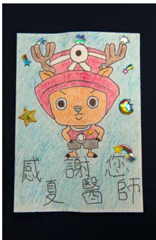
■ 廖小弟弟親手繪製卡片，感恩醫療團隊。