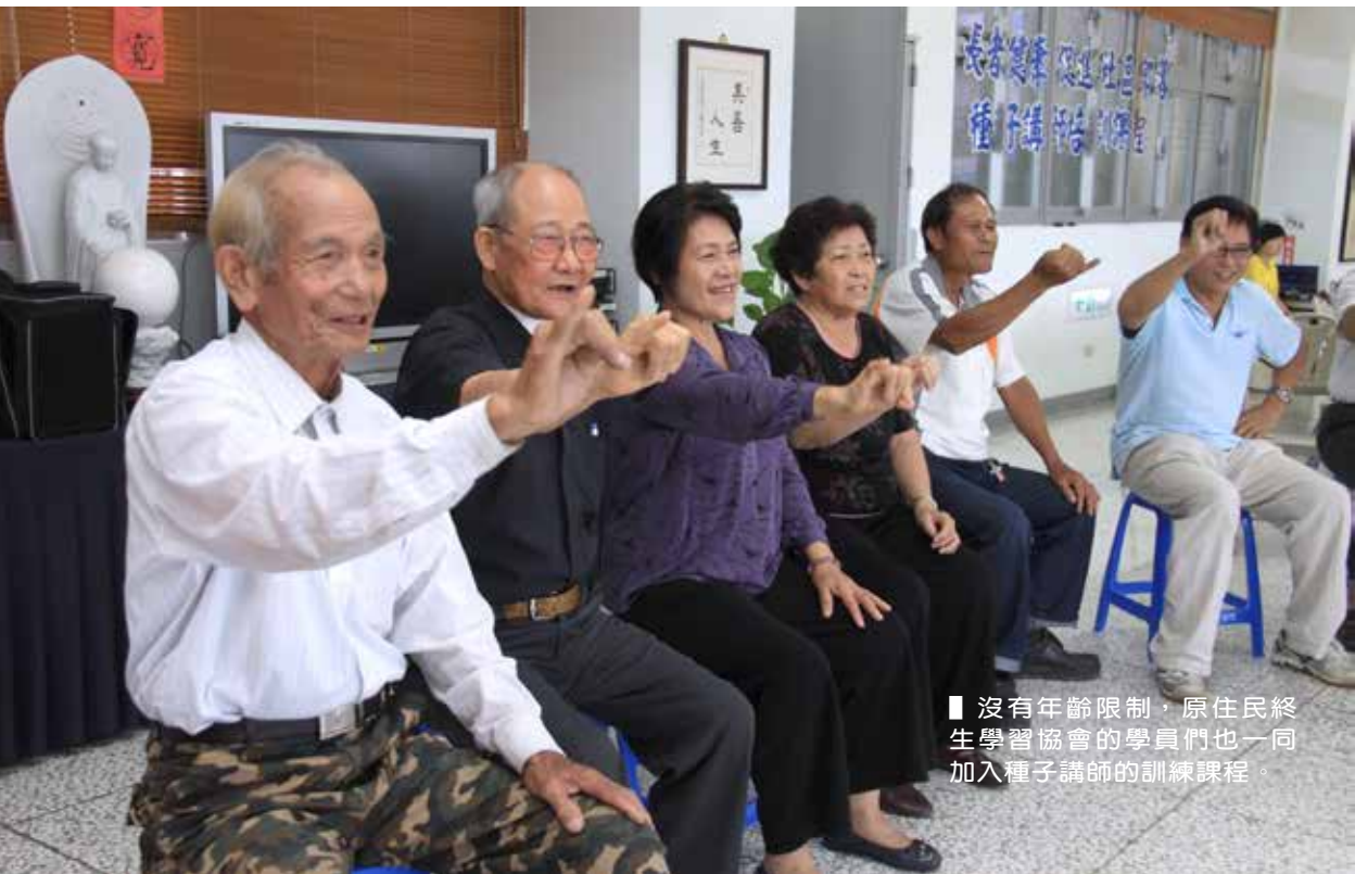
■ 沒有年齡限制，原住民終生學習協會的學員們也一同加入種子講師的訓練課程。