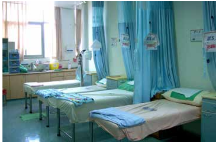
■ 關山慈院婦產科原本的門診空間改置成中醫治療場所，提供民衆接受針灸等治療。