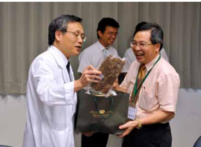
■ 簡院長拿出大愛農場自己生產的健康作物——芒果和蘿蔔乾與委員結緣。

進行各項資料準備，期待慈濟能為國爭光，獲得全球金獎，並希望在嘉義縣衛生局的協助下，將相關經驗分享給雲嘉南地區的醫院。