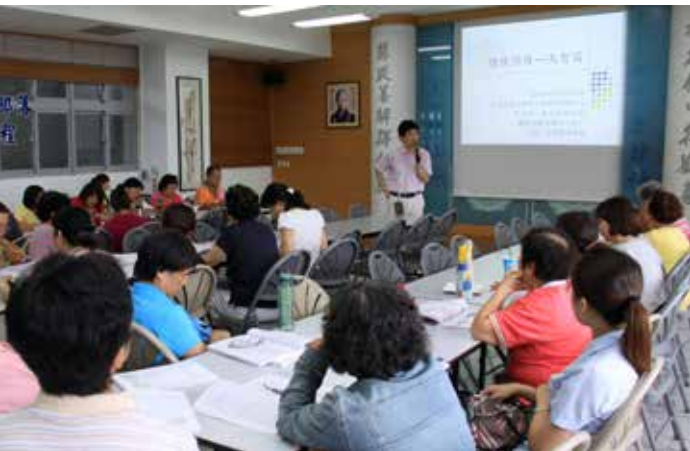
■ 十三種不同面向的課程內容，讓學員們收獲滿滿回到社區更可學以致用。

的「長者健康促進社區部落種子講師」培訓課程，活動中特地安排了腦力測驗的活動，透過時下流行的電子遊戲，讓學員們體認身心健康的重要性。