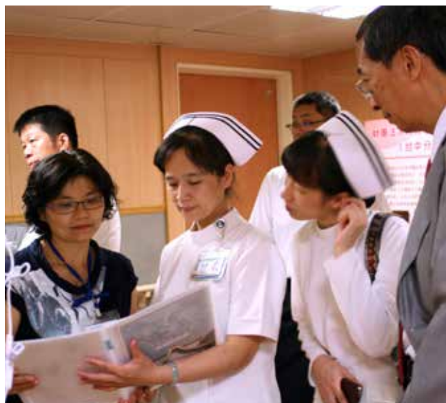
■ 委員們走訪到病房區，了解是否有放置戒菸宣導衛教單張及禁菸規範。

護服務網絡認證」訪查，是國民健康局與國際接軌的健康促進計畫，臺中慈院身為健康促進醫院，自然責無旁貸，也希望藉著學者、專家的訪查，促使各項無菸措施更進步。