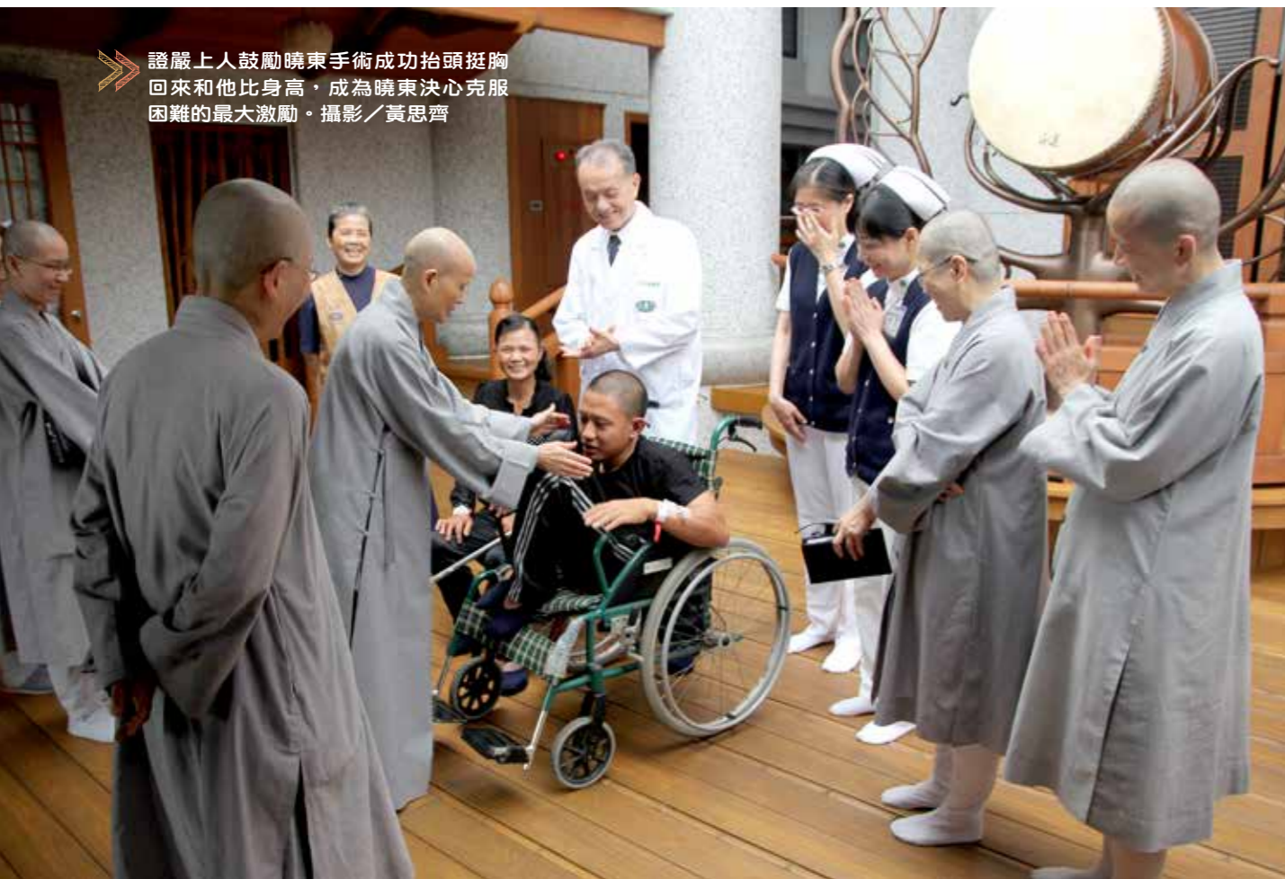
➤ 證嚴上人鼓勵曉東手術成功抬頭挺胸回來和他比身高，成為曉東決心克服困難的最大激勵。