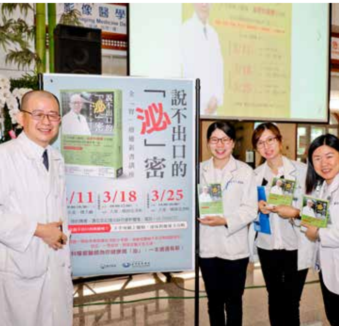
院內同仁也熱情響應簽書活動。

增加罹患膀胱癌機率，乾脆一勞永逸，只是這造型讓理髮廳就賺不到錢了。三句不離本行的幽默話語引來觀眾笑聲與掌聲。