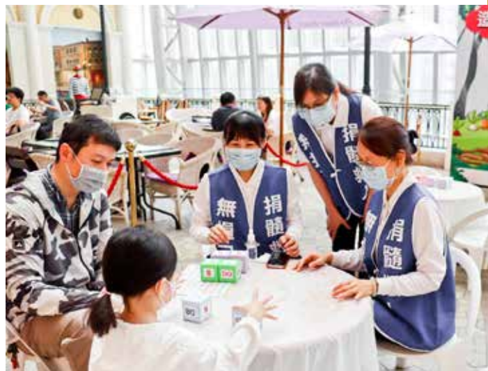
造血幹細胞捐贈驗血建檔宣導，邀約大眾加入「救人一命、無損己身」的配對行列。