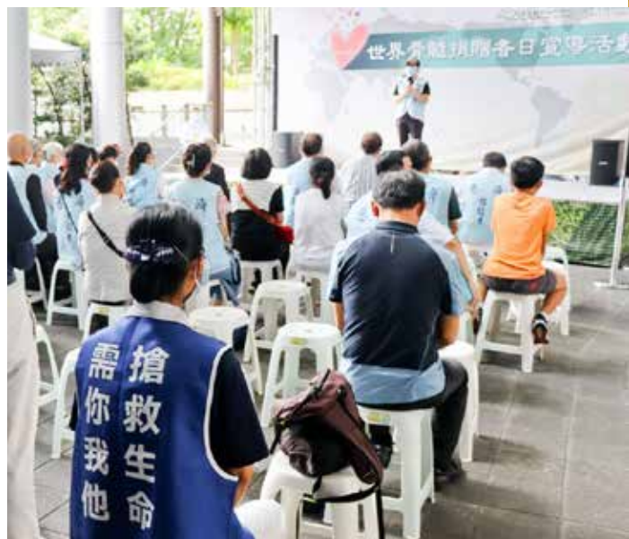
世界骨髓捐贈者日，向全球造血幹細胞捐贈者致敬。

的造血幹細胞資料庫，雖然資料庫建檔超過四十五萬筆，但年年需淘汰超過五十五歲的建檔資料，近兩年來疫情阻擋了驗血活動，急需青年建檔，為血液疾病患者注入重生的希望。🌱