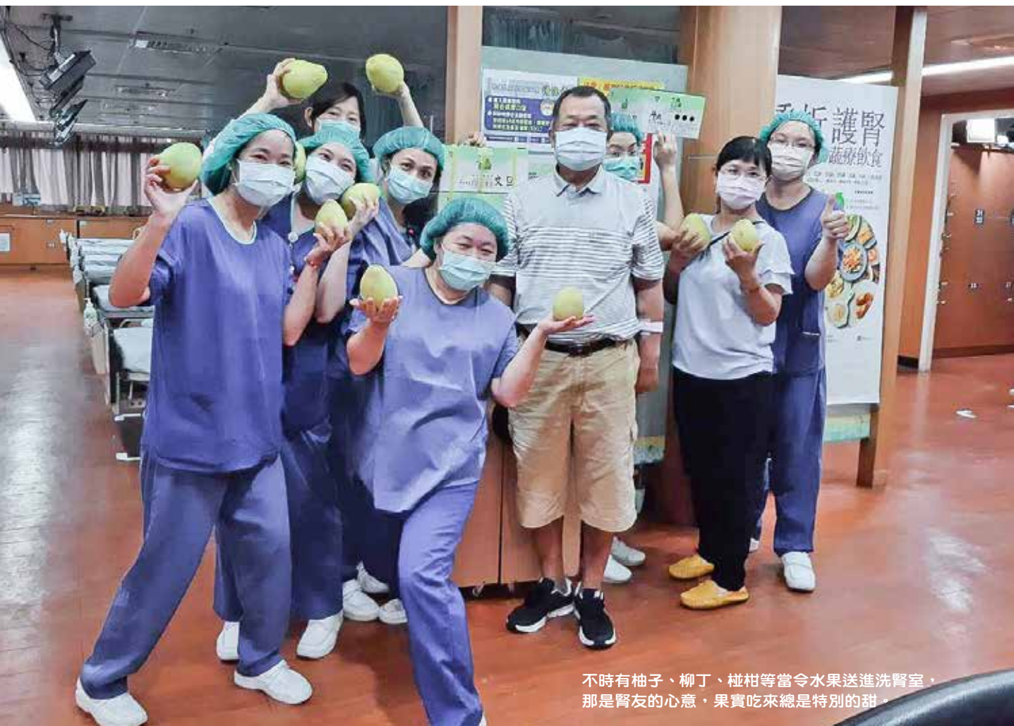
不時有柚子、柳丁、椪柑等當令水果送進洗腎室，那是腎友的心意，果實吃來總是特別的甜。