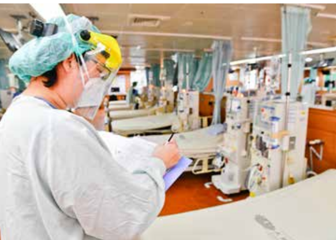
在病人來洗腎前，護理師仔細打理，做好萬全的準備。

二〇二二年確實是護理團隊能量爆發且發光發熱的一年，獲得許多學會與國家品質獎項的光環。但若病人所言不虛，回到日常的環境裡，翻轉洗腎室的神奇因子是什麼？而讓原本安靜與緊張氣氛交錯、藥水五味雜陳空間中多了濃濃人情味的關鍵，到底是什麼？