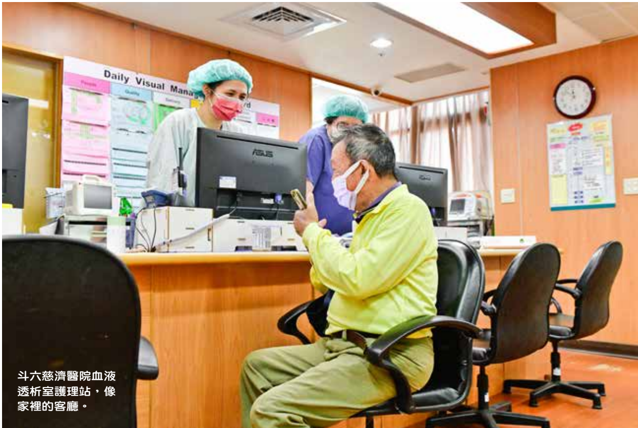
斗六慈濟醫院血液透析室護理站，像家裡的客廳。