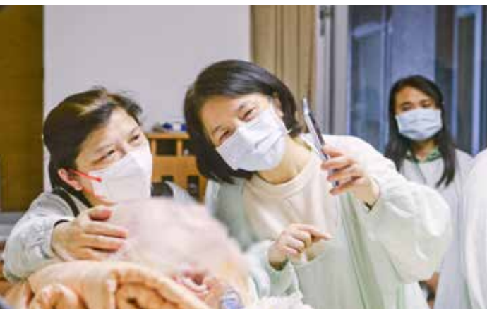
女兒們特別錄製影片讓陳爺爺看看家裡的一切。

便把時間留給家屬。病房內，陳奶奶溫柔握起老伴的手，說道：「我們已經結婚六十年了，你還是一樣很帥氣，謝謝你陪伴我、陪伴這個家庭一輩子，現在我們都在你身邊，你已經很勇敢了，我愛你。」