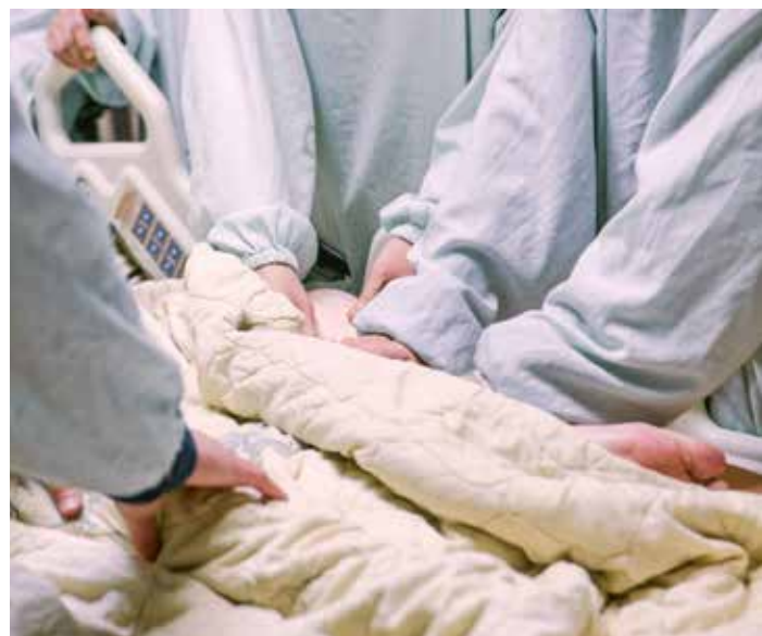
孫子們貼心替爺爺按摩小腿。

或許無法阻擋無常的到來，但臺北慈院醫護團隊希望透過最溫暖的愛照顧與陪伴病人及家屬，讓生者能夠少一些缺憾，繼續往下走。（文／鄭冉曦）