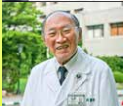
花蓮慈濟醫院榮譽院長 曾文賓 教授