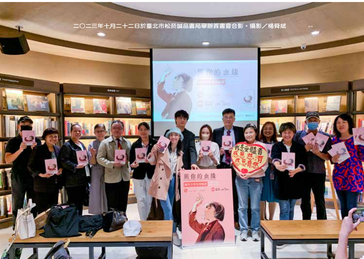
二〇二三年十月二十二日於臺北市松菸誠品書局舉辦簽書會合影。

期待《與你的血緣 (Have I Found You?)》得到更多年輕人的認同，歡迎十八歲以上的朋友，挽袖捐出十西西的血樣建檔，讓某一個孤單的血癌患者多一絲生命的希望。