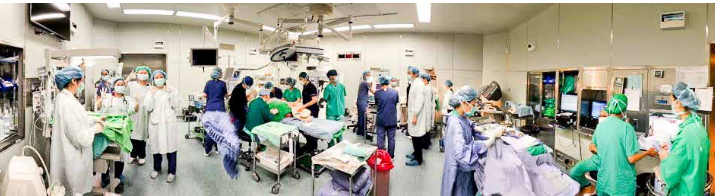
二〇二〇年十一月十四日凌晨零點的手術室，共有四組婦兒科的醫護團隊在接生和緊急處置。

二〇二〇年的十一月十四日凌晨十二點鐘，真真、平平、安安三姊弟在台北慈濟醫院誕生。