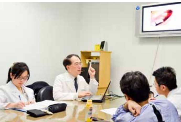
🎭 不管是口腔外科會議或是臨床教學，都可見夏主任不吝傳承的身影。