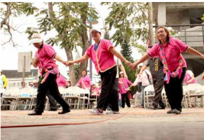
■ 長青班的學員們帶來部落舞蹈，讓開幕氣氛健康又熱鬧。

牌儀式上指出，關山慈濟醫院自二〇一〇年度起承辦部落社區健康營造計畫，至今為第三年度，因地制宜進行社區健康營造，像是在社區借場地舉辦志工培訓，並由關山慈院的專業護理衛教師及種子志工開辦教育訓練，最大的目的就是希望