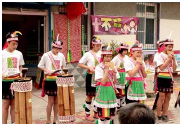
■ 電光國小吞互樂團以竹製傳統樂器演奏，揭開活動序幕。