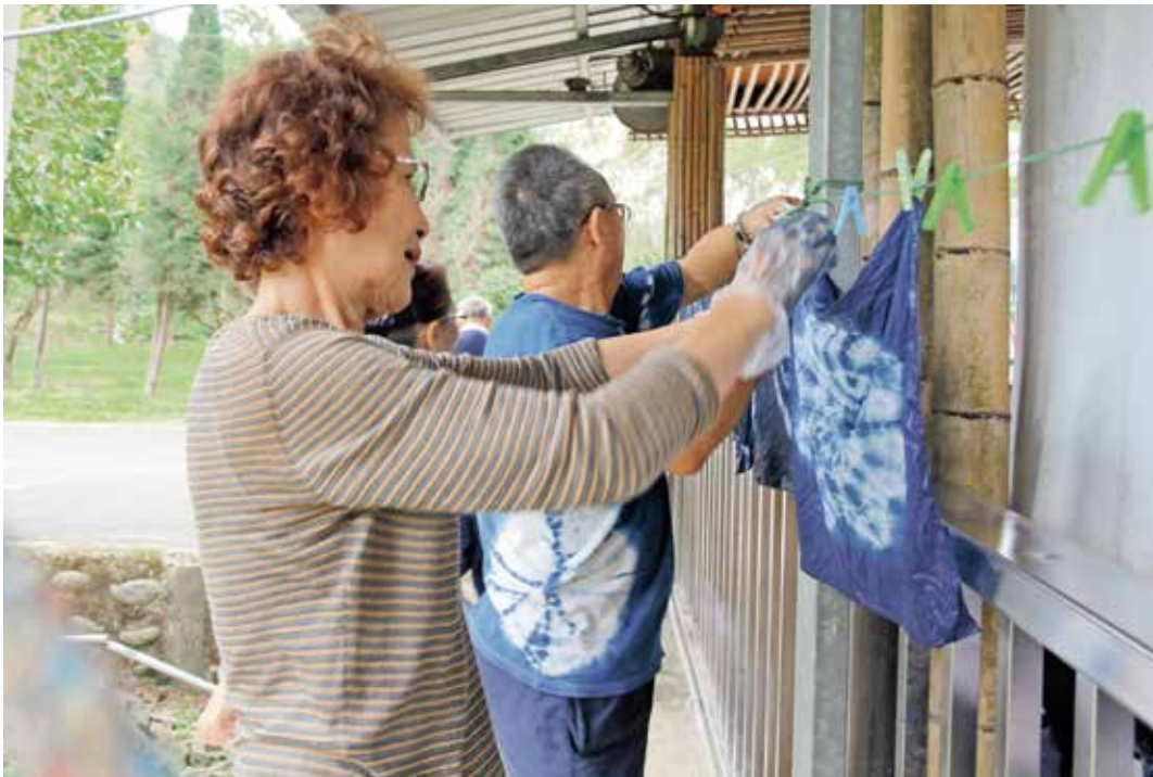
看到遺族家屬願意出來參加活動，重現笑容，讓心蓮團隊放心不少。