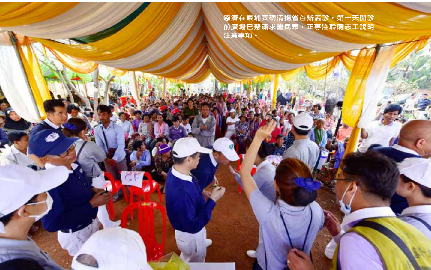
慈濟在柬埔寨磅清揚省首辦義診，第一天開診前廣場已聚滿求醫民眾，正專注聆聽志工說明注意事項。