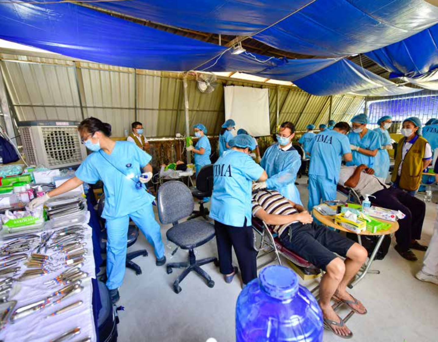
新加坡人醫會先遣團隊提前布置場地，將轉診醫院的倉庫變身為乾淨的牙科診間。

醫師帶領來實習，這種(非營利組織的教學傳承)方式也是慈濟人醫會可以學習的。」慈濟也贈與手術電燒刀給東國總理青年志願醫師協會，希望當地醫療人員能有充足醫療資源為民眾服務。