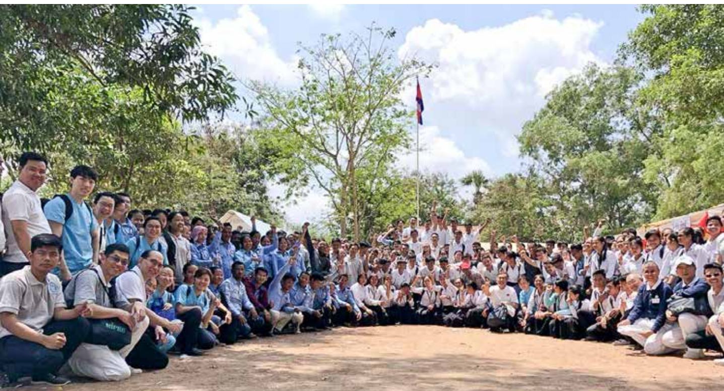
義診活動圓滿完成，跨國醫療團隊互道後會有期。