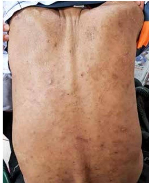
因尿毒症導致搔抓成傷的黃先生接受中西合療，使用中醫藥浴包和止癢藥膏後，皮膚搔癢大為改善。左圖為中醫治療前，右圖治療兩個月後。