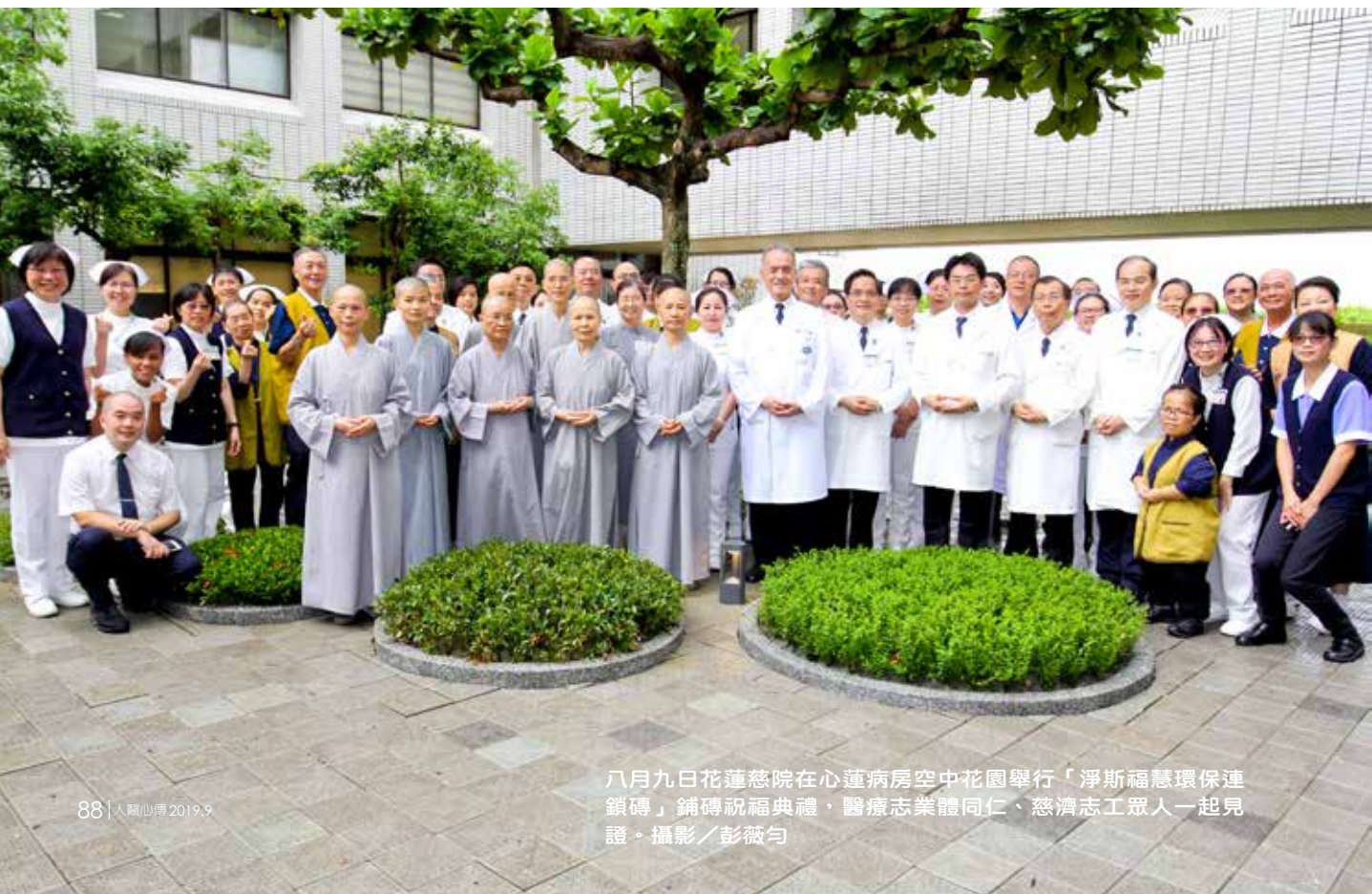
八月九日花蓮慈院在心蓮病房空中花園舉行「淨斯福慧環保連鎖磚」鋪磚祝福典禮，醫療志業體同仁、慈濟志工眾人一起見證。

七位靜思精舍常住師父也特別蒞臨祝福，德如法師表示，以菩薩心照顧病人猶如自己的親人，感恩全院同仁合心和氣、互愛協力，以愛的聯手，照護病人，也祈禱社會祥和，人心能淨化，天下災難就能減少。