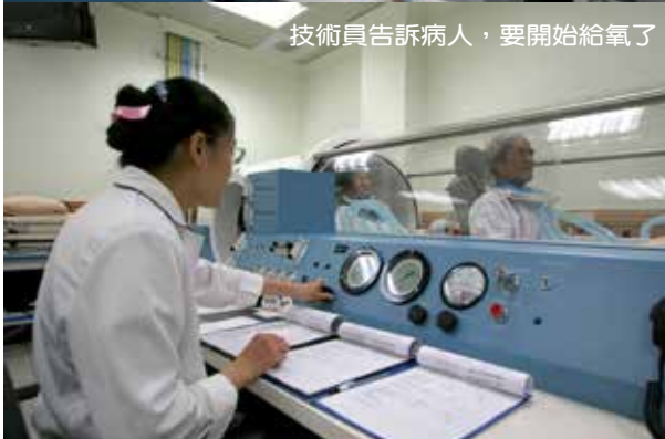
技術員告訴病人，要開始給氧了