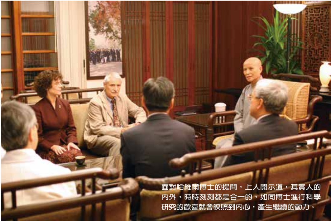
面對哈維爾博士的提問，上人開示道，其實人的內外，時時刻刻都是合一的，如同博士進行科學研究的歡喜就會映照到內心，產生繼續的動力。

我。上人常言「人生劇本自己寫」，就是如此，上一世我們已經將今生的劇本寫妥；而這一世的所作所為，則是為來生寫下了新的劇本。