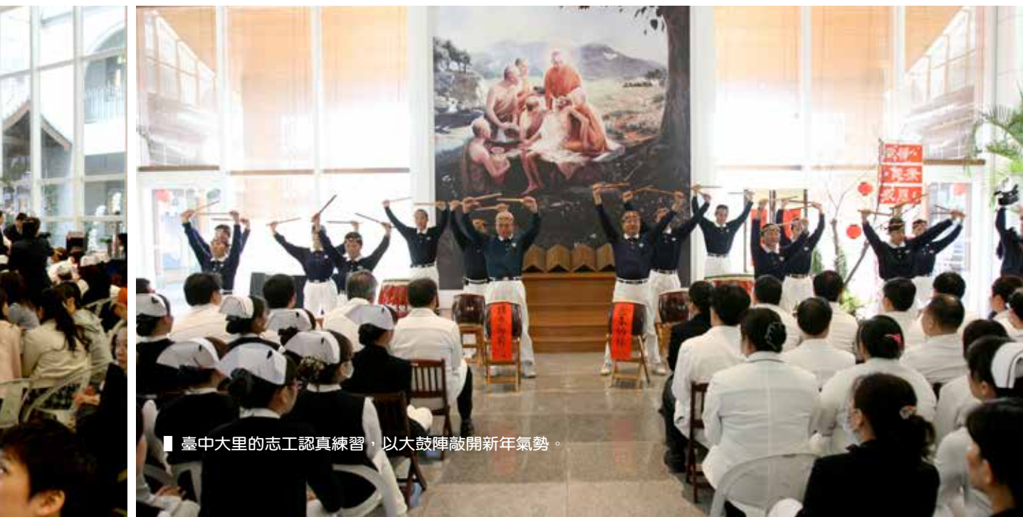
■ 臺中大里的志工認真練習，以大鼓陣敲開新年氣勢。