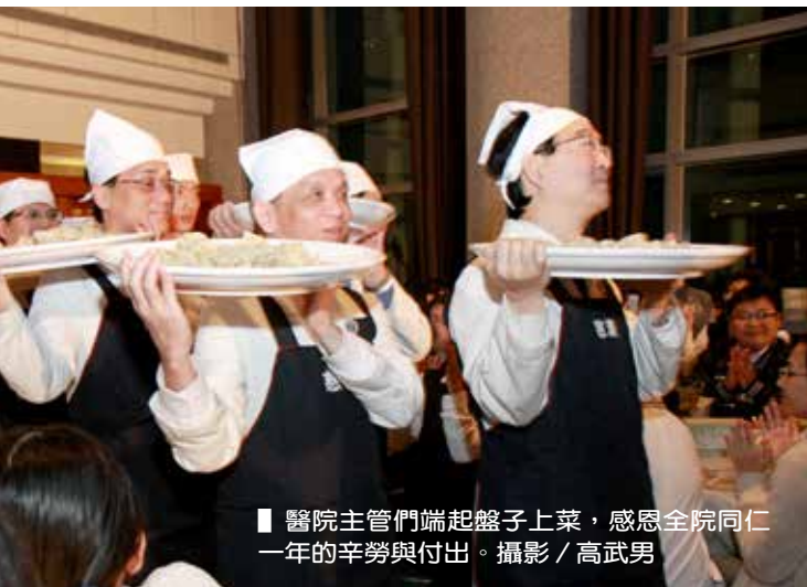
■ 醫院主管們端起盤子上菜，感恩全院同仁一年的辛勞與付出。