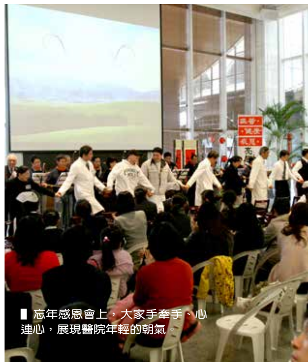
■ 忘年感恩會上，大家手牽手、心連心，展現醫院年輕的朝氣。