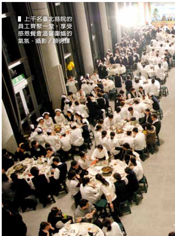
■ 上千名臺北慈院的員工齊聚一堂，享受感恩餐會溫馨圍爐的氣氛。