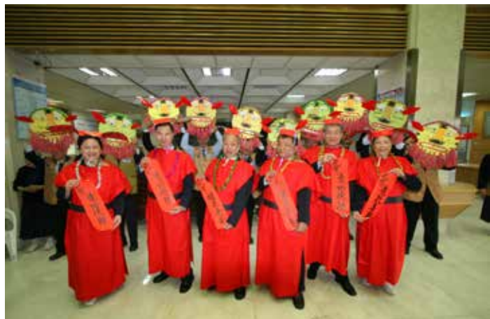
■ 社區志工們精心設計、製作各種道具，將喜氣與年味帶進醫院。