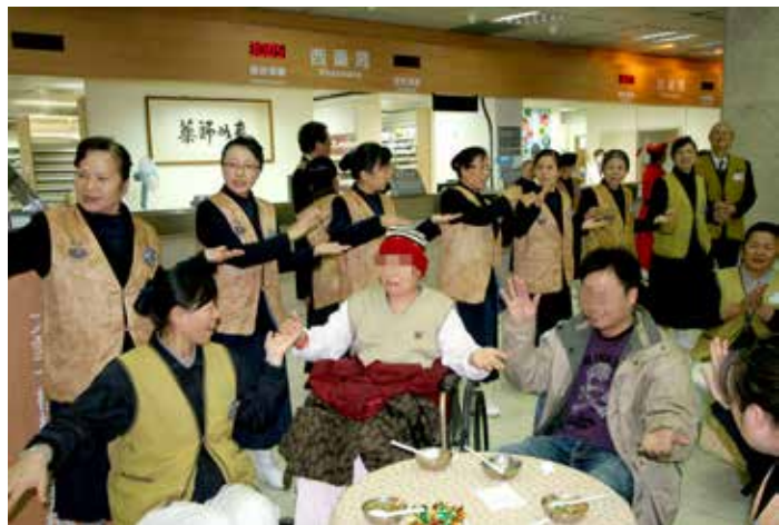
■ 下午茶會有志工群的陪伴，讓不能回家過年的住院病人與家屬感受到無限的溫馨。