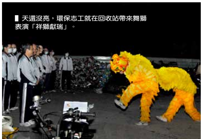
■ 天還沒亮，環保志工就在回收站帶來舞獅表演「祥獅獻瑞」。