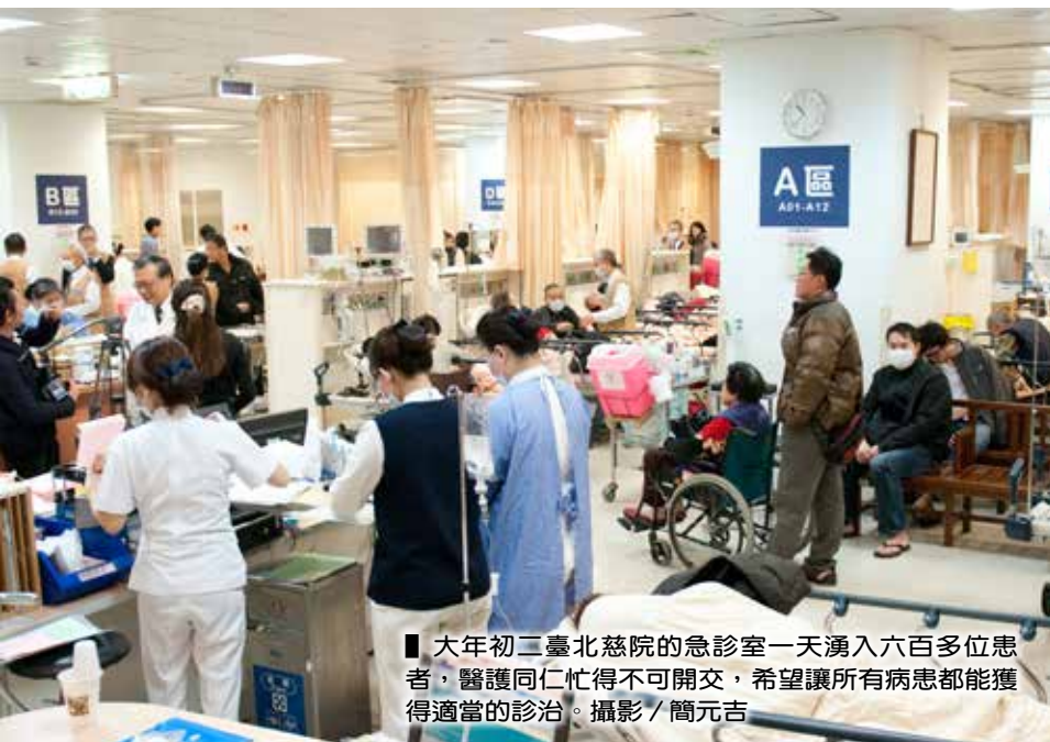
■ 大年初二臺北慈院的急診室一天湧入六百多位患者，醫護同仁忙得不可開交，希望讓所有病患都能獲得適當的診治。

唯有衆多人鋪路，用心用愛種福緣，方能開路種樹耕福田」。上人也言及，能有因緣聞法，也需要衆人鋪路，用心用愛種福緣，方能綠林成蔭，秉持虔誠的心念展開兔年的醫療任務。趙院長也勉勵慈院同仁把握因緣參加培訓，每一位都能開路種樹耕福田。（文／蘇錦俐）