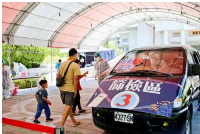
這次快篩站每天出動一位小兒科醫師，來幫忙孩子採檢外，只要父母、長輩帶著幼兒一起來採檢站，工作人員將會引導優先做篩檢，避免家長與孩子等待過久。