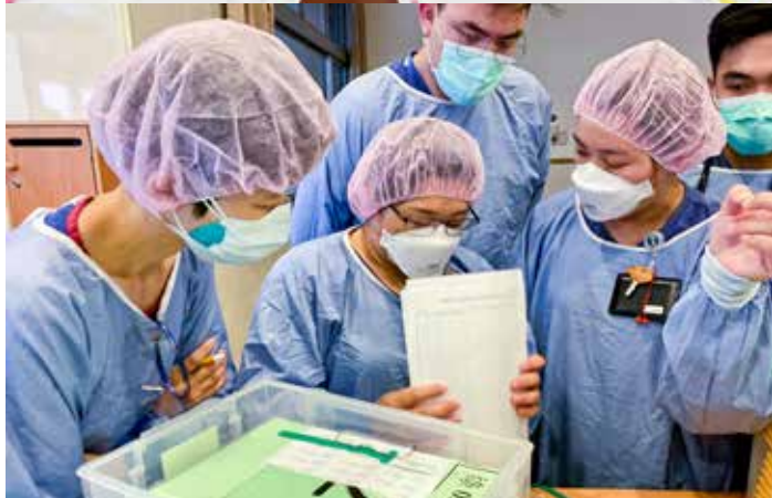
四月二十六日急診團隊全數解隔歸隊，重返防疫第一線並肩作戰。