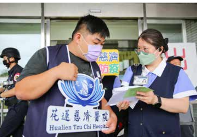
居家照護服務員可以在接受長照病人委託後，協助進行代送藥物服務。攝影／江家瑜

購或代領或代送服務」規範，居家照護服務員可以提供代送餐食、食材、生活用品、藥品、補助品……等服務。