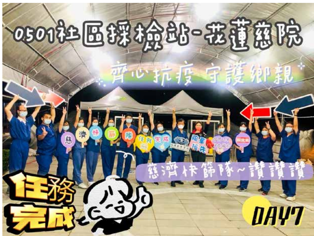
七日快篩任務圓滿。