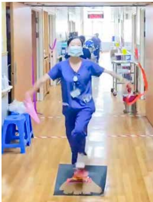
解除隔離日，團隊在合十病房讓病人衝破封鎖線、跨過火爐，象徵隔離解除，也去除穢氣。