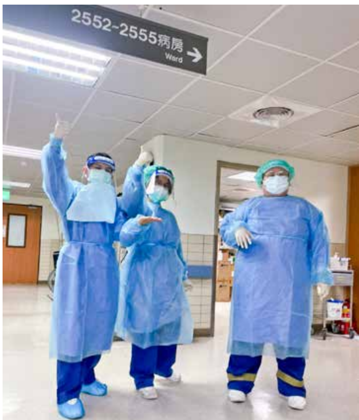
終於可以解除隔離了，護理同仁與病人一起慶祝。