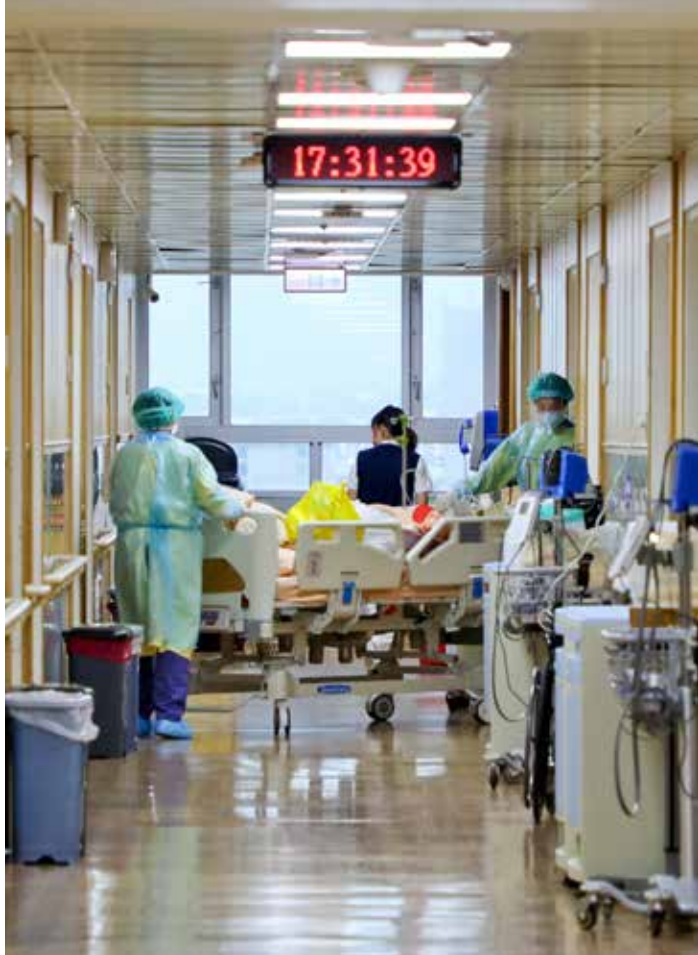
四月十四日，合十一病房病人陸續轉到合十病房。

本該一如往常的平靜夜裡，卻多了分緊張，合十一病房緊急召回相關人員返院普篩，雖然每個人都戴著口罩，但內心的不安藏不住，同仁都擔心自己染疫影響到親愛的家人，甚至篩檢完後也不敢回家，都要等報告確認為陰性之後才