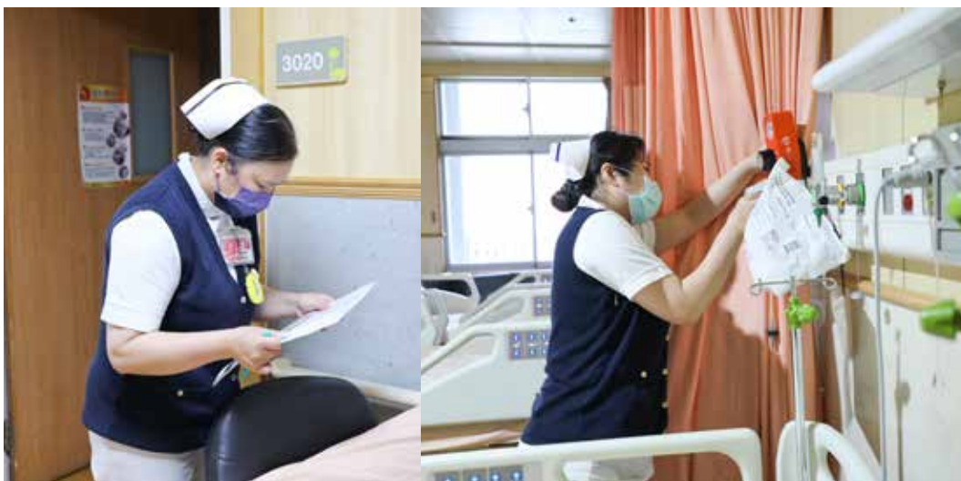
合心樓所有病房的護理長、副護理長及護理學妹們總動員，一起來協助搬病房。