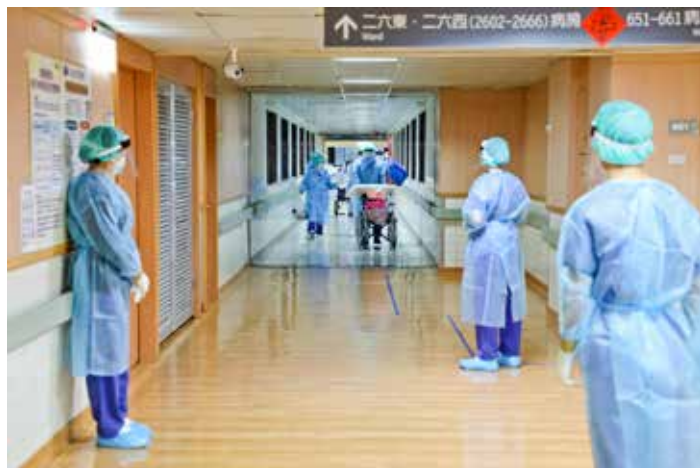
四月十四日二五西病房大清消，所有病人移至六西病房。