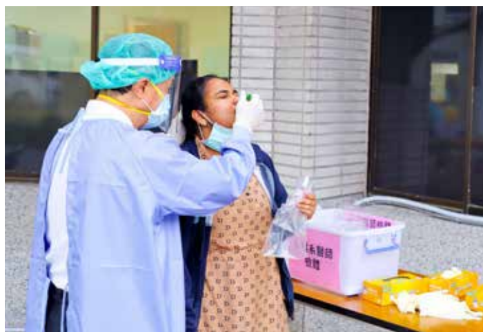
院長室主管投入 PCR 快篩，同仁覺得好溫馨。