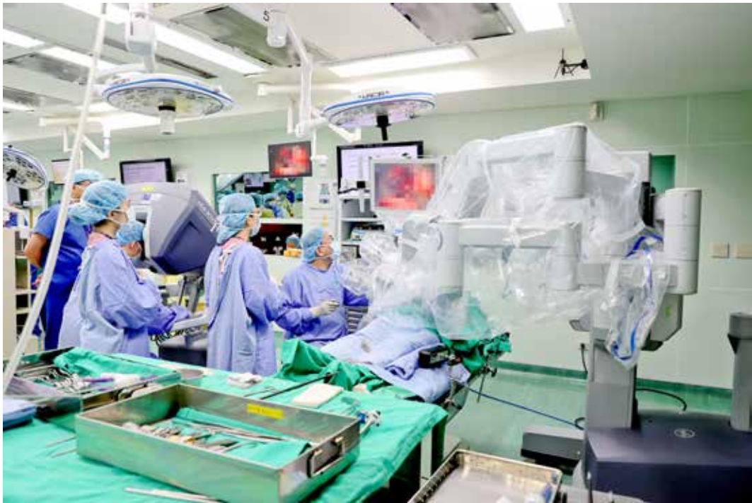
「大體老師達文西全人模擬手術教學」的上午課程由臺大醫院心臟血管外科紀乃新醫師指導「心臟二尖瓣修復術和二尖瓣置換術」。