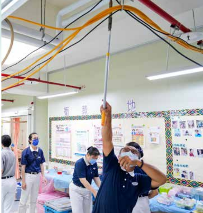
牙科器械管線的配置從地面到天花板，有賴管線志工團隊縝密的規畫與執行作業。

五月十九日義診團隊續往慎修養護中心，為住民及身心障礙朋友提供醫療服務。慈濟人醫會定於每年的五月、十一月前往臺東舉行義診，至今已九個年