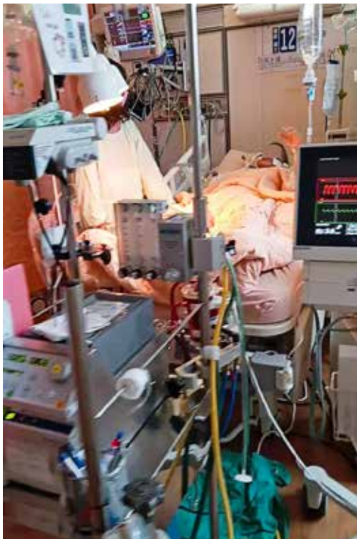
葉克膜（左）加微型人工心臟（右）。