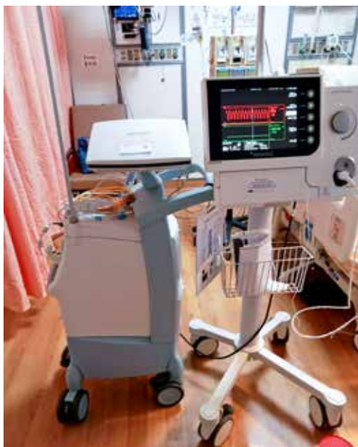
即將移除的微型人工心臟 Impella (右) 和待命備用的心室輔助器 (左)。

到二十日這一天，Impella 微型心臟的功率開到P2 最低檔。十二月二十一日，再進開刀房，移除微型人工心臟。原本以為最久只能放到十四天，想不到放了二十二天。主任解釋，是因為後來心臟的依賴程度慢慢往下調，就可以用得久一點。在移除的前一天晚上，護理師搬來一臺長相不同的心室輔助器，說明是萬一在拆除的過程中不順利就必須接上的備用品。幸好再回加護病房時，微型人工心臟不見了，那臺心室輔助器