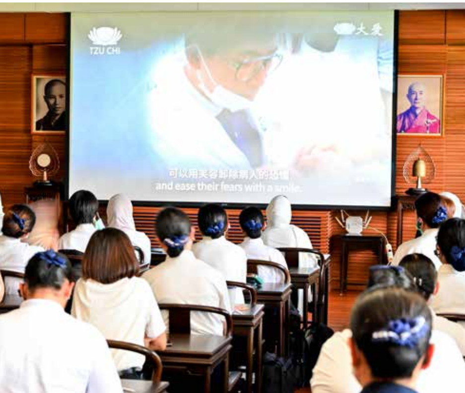
九月十七日人醫學員返回精舍參與圓緣，會中播放蔡宗賢醫師的 AI 模擬生成影片。

編按：為期兩天半的二〇二四國際慈濟人醫會年會，課程扎實精采，礙於篇幅有限無法於本期全部呈現，將陸續於《人醫心傳》刊登分享。