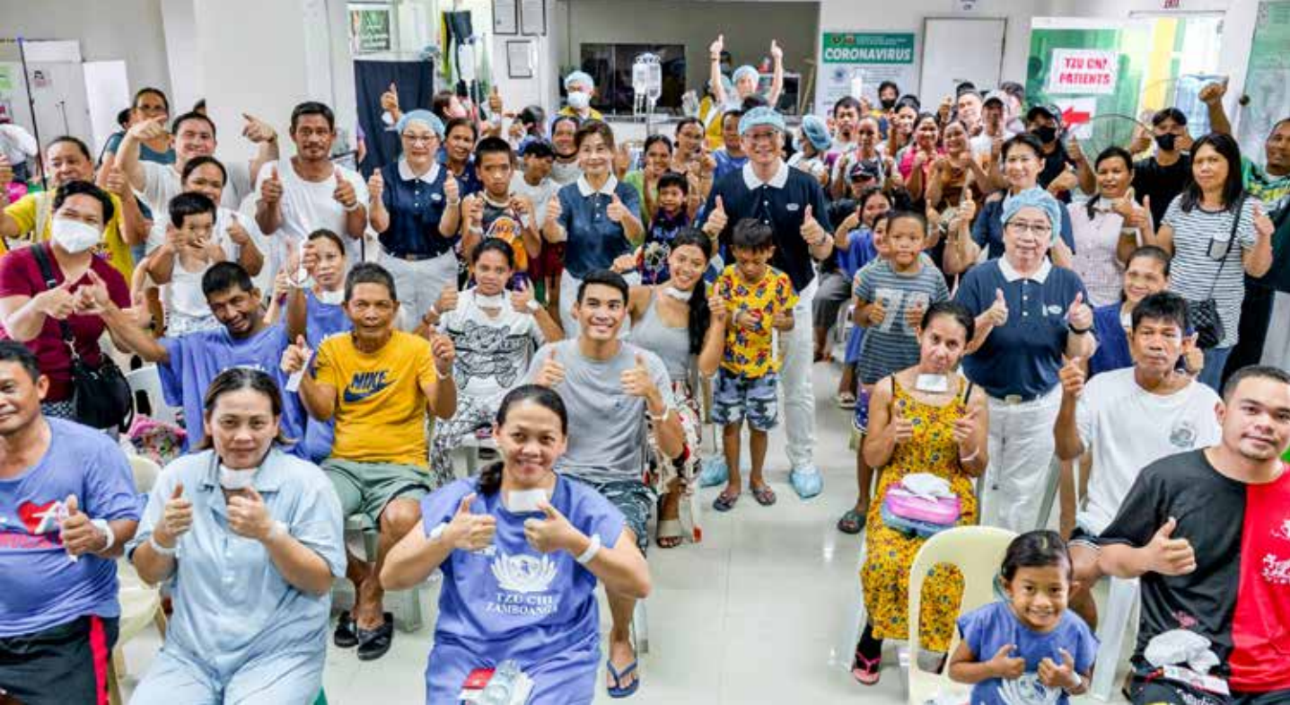
菲律賓人醫會偏鄉義診持續近三十年，圖為二〇二四年七月十一日至十三日在禮智省 (Leyte) 省立醫院外科手術義診，為貧病鄉親除痛苦。

其簡陋，沒有麻醉機，幾張辦公桌擺一擺當手術檯，甚至連基本的手術燈都缺乏，他們用普通的電燈、人工拉線控制光源高度，用紙板包裹充當燈罩以集中光束，為病人開刀治療。