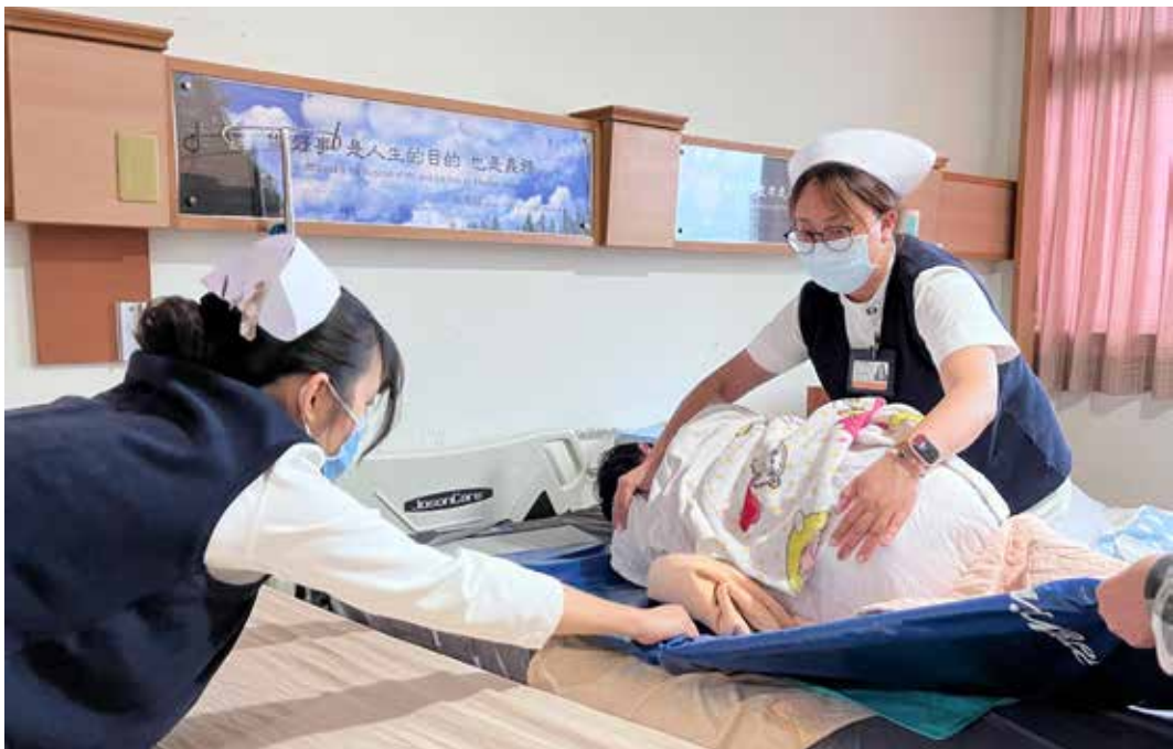
護理師是醫療團隊不可或缺的成員，涂先生的第一線照顧者。