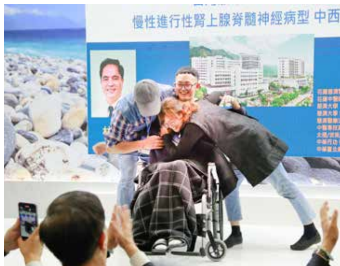
涂先生與父母開心地擁抱。

片段，涂先生和媽媽同時流下眼淚。接受造血幹細胞移植之前，是他生病以來歷經生死拔河最艱難的時候，但這也是他和慈濟醫療接觸的開始，先是在茫茫人海中獲得來自捐贈者的無私大愛，接著他接收到花蓮慈濟醫院中西醫合療與幹細胞療法相關訊息，重燃希望，決定跨過中央山脈，從臺中到花蓮拚一拚。