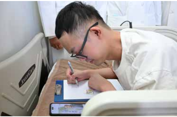
涂先生身體狀況恢復到可以再拿筆畫畫，手繪證嚴上人畫像送給上人，上人也送他歲末祝福的福慧紅包，給予誠摯的祝福。

來調節體內經絡的氣流運行，進而刺激神經和肌肉活動，以改善運動協調和減少肌肉痙攣。用在涂先生的精準中藥治療，材料包括：蒲黃（香蒲）、遠志、川棟、浙貝母、黃耆、益母草、苦參、酸棗仁、橙皮、射干。