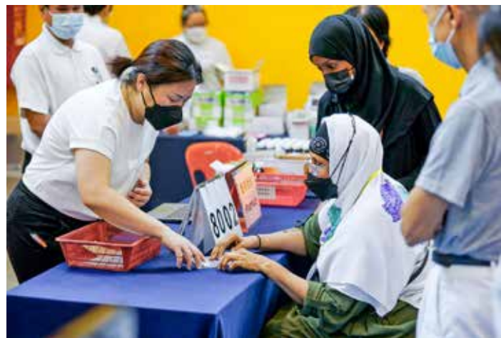
領藥時，藥師為病人說明用藥注意事項。