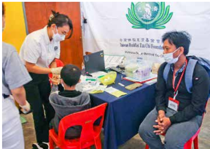
義診上，醫師為男童診治手腳的膿瘡，一旁的父親終於放下心中大石。

圖片，營養師以遊戲互動的方式，教導孩子認識穀類、蛋白質食物及高纖維食物。若對象是大人，便翻開《全植物性飲食食譜》，詳細解釋如何吃得健康。大人小孩都聽得非常專注。