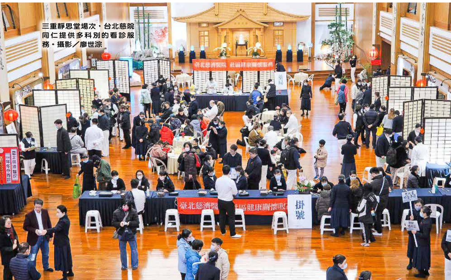
三重靜思堂場次，台北慈院同仁提供多科別的看診服務。

慈善與醫療結合，慈濟人發揮愛與團結的力量，在寒冬中傳遞溫暖，讓弱勢鄉親們在充滿祝福的氛圍中，感受到家的溫暖，對迎接嶄新的一年，充滿了希望。