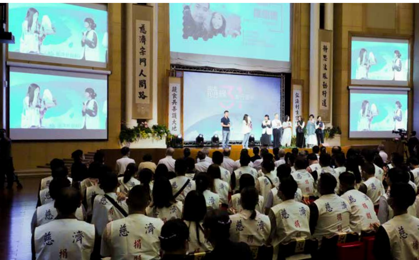
臺下的一群捐隨者，都是付出無私愛心救人的無名英雄。