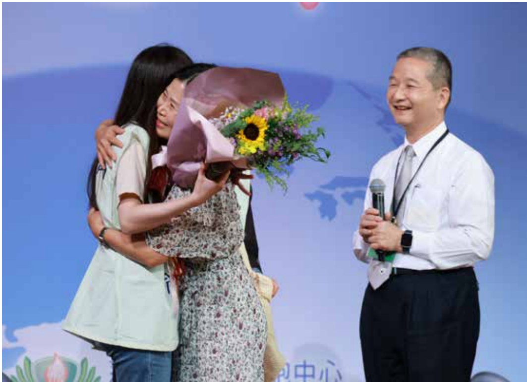
歐爸爸（右）說：「感謝上人及慈濟所有師兄師姊，更感謝捐贈給我女兒的捐贈者，感謝你們！」