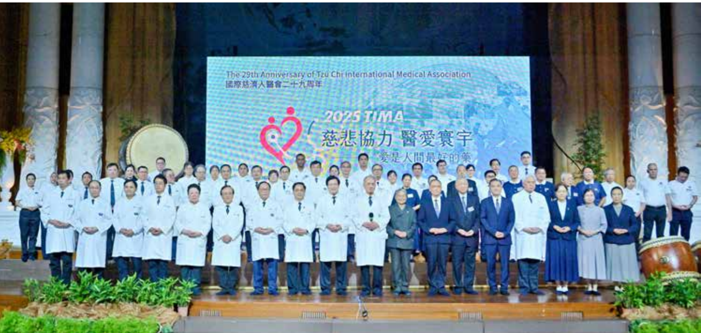
二〇二五年國際慈濟人醫會年會十月四日至七日在花蓮靜思堂舉行，首日開幕式上，指導師父、各志業體執行長、各院院長以及各個國家地區人醫代表互道祝福與感恩。

接著，全場齊聲唱誦〈慈濟功德會會歌〉，回顧證嚴上人創立慈濟的初心，體會師父「為佛教，為眾生」拔苦予樂的大愛悲心。