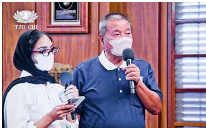
約旦人醫會希芭醫師與陳秋華執行長。