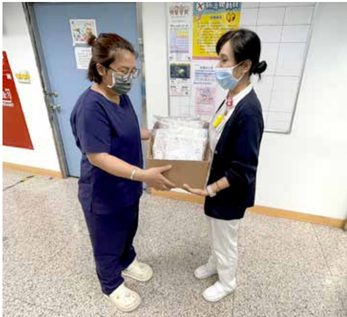
九月二十六日，風災導致關山慈院 IDS 團隊暫停看診，團隊緊急為七名病人開立藥物，透過海端鄉衛生所轉交消防隊運送上山。