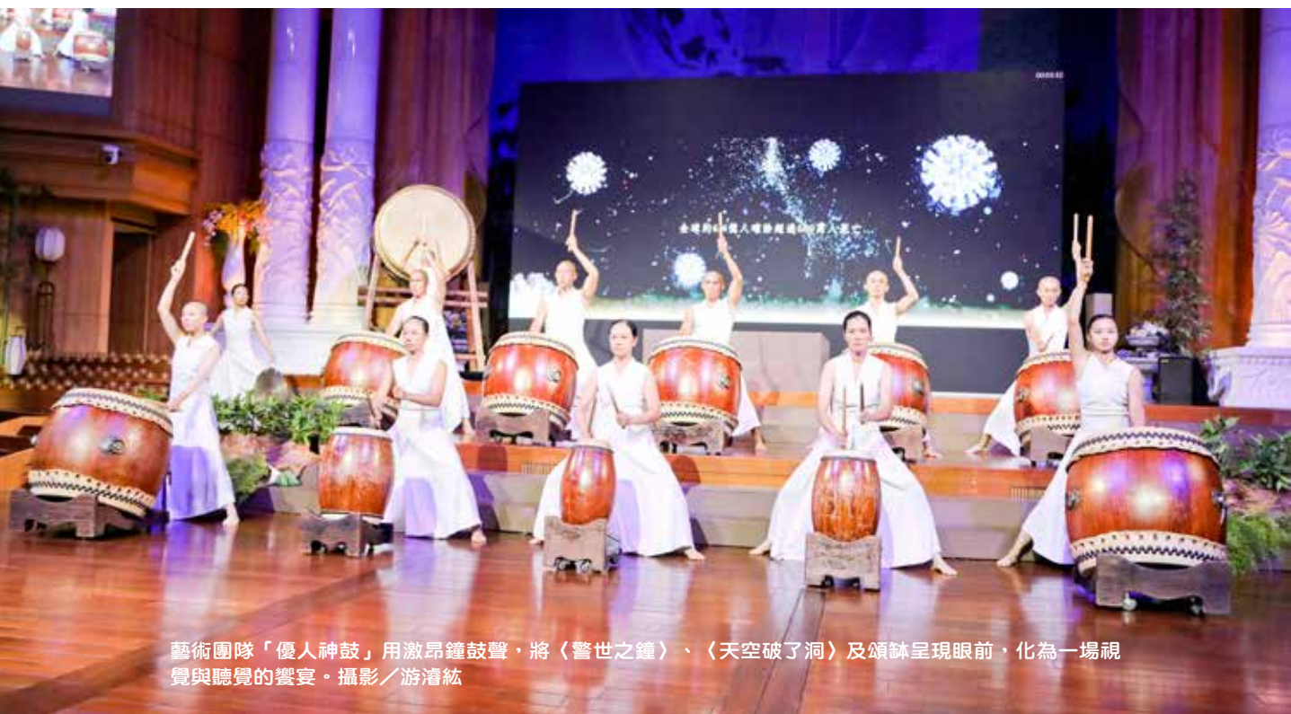
藝術團隊「優人神鼓」用激昂鐘鼓聲，將〈警世之鐘〉、〈天空破了洞〉及頌鉢呈現眼前，化為一場視覺與聽覺的饗宴。