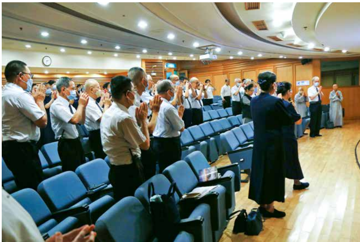
各功能組相見歡，討論細節流程，確年會順利圓滿。