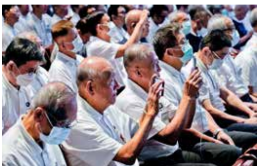
人醫會成員也感動於大量青年志工主動付出，用手機記錄顏執行長分享簡報。