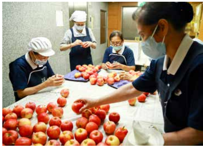
生活組志工仔細擦拭每一顆蘋果，祝福學員平安，收穫滿滿。