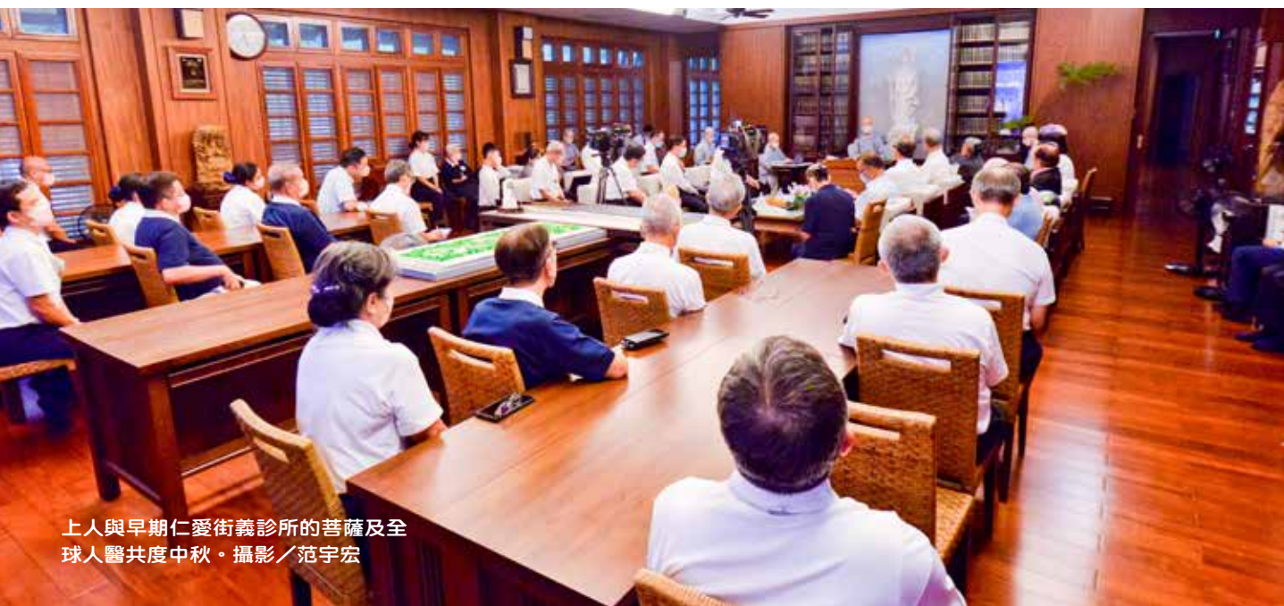
上人與早期仁愛街義診所的菩薩及全球人醫共度中秋。攝影／范宇宏

上人最後開示：「臺灣幾十年來真正的很祥和，教育得好，培養出了年輕人有愛，這一回光復的災才會這麼快速湧進了將近兩萬年輕人。全臺年輕人動員，我很感動。看到臺灣那一種的善的美，大家真誠的心去投入。我們這幾十年來這樣經營過來，教育過來，感覺平安就是福，真心感恩。」