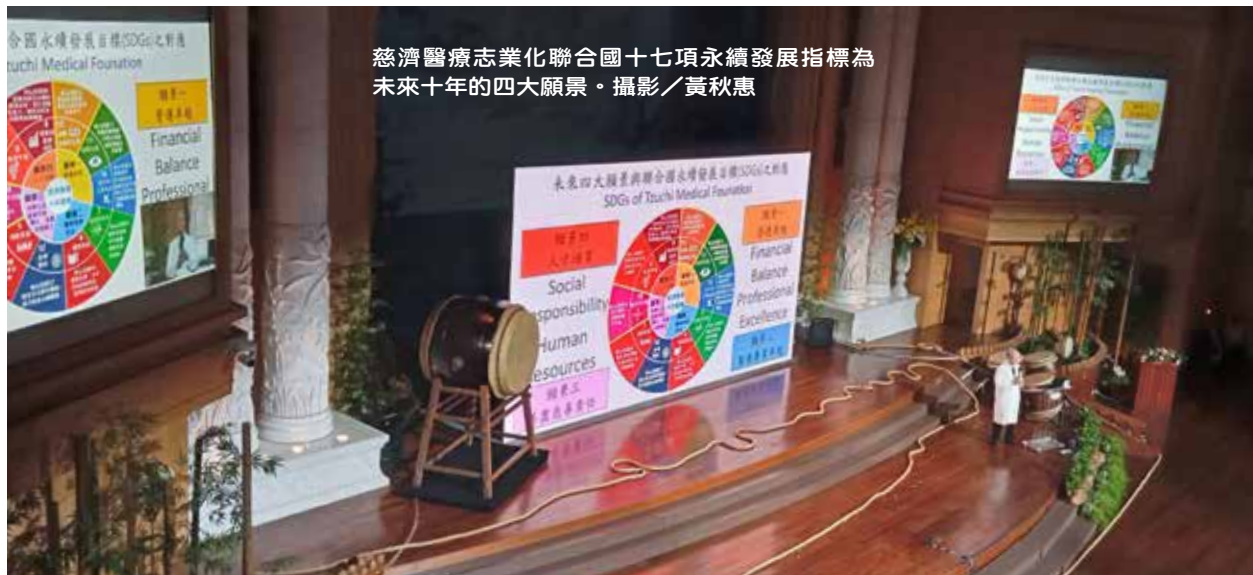
慈濟醫療志業化聯合國十七項永續發展指標為未來十年的四大願景。