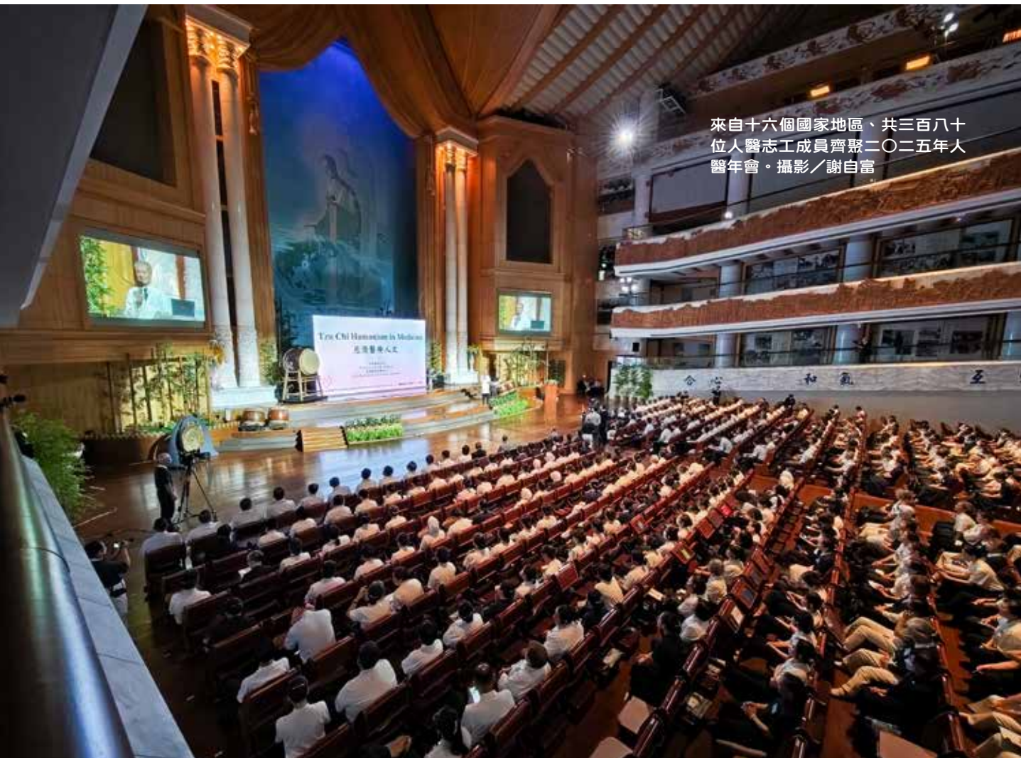
來自十六個國家地區、共三百八十八位人醫志工成員齊聚二〇二五年人醫年會。

優人神鼓團隊以鐘鼓演繹〈警世之鐘〉，氣勢磅礴的鼓聲感動在場所有學員，在強弱有序、整齊劃一的鼓聲中，配合沉穩悠揚的鐘聲，象徵地球正在對人類的發出求救信號，提醒大眾需更加重視地、水、火、風四大不調所引起的環境變化與災難，接下來的「與地球共生息」演繹：「天空破了洞，補天的女媧那裡找？」感恩上人曾慈示，用鼓掌