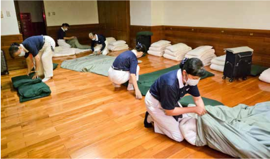
寮房組貼心為工作人員及學員裝被套。