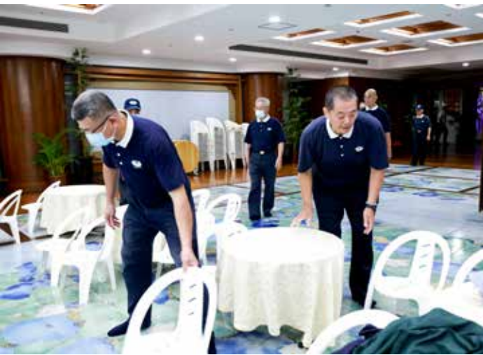
機動組隨時待命協助各功能組布置場地。