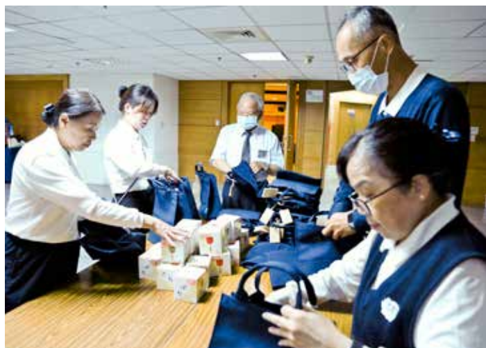
台北慈濟醫院的工作人員整理結緣品。

人醫年會在十月七日圓滿結束，台北慈濟醫院趙有誠院長感謝所有大北區志工的協助，以及台北慈院同仁們的投入。其中，大北區人文真善美團隊一路的記錄，甚至熬夜趕製，將三天年會點滴濃縮為八分鐘的圓緣回顧影片，無限感恩。🌱