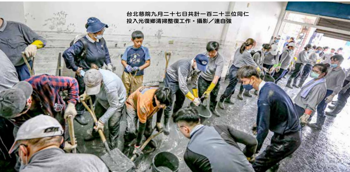
台北慈院九月二十七日共計一百二十三位同仁投入光復鄉清掃整復工作。

分工清掃與發放醫藥包，不僅提供災後所需支援，也傳遞第一線的關懷與陪伴，這分助人的踏實感，將眾人成為一輩子難忘的感動。