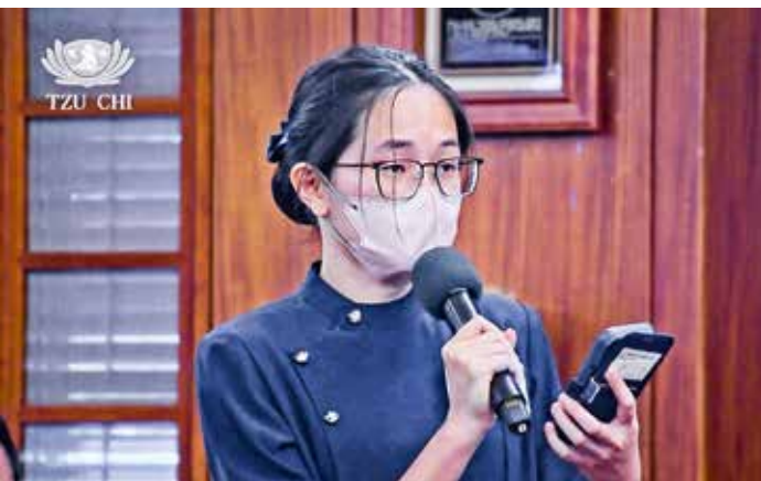
馬來西亞招妹好醫師希望把在年會的感動化為行動。