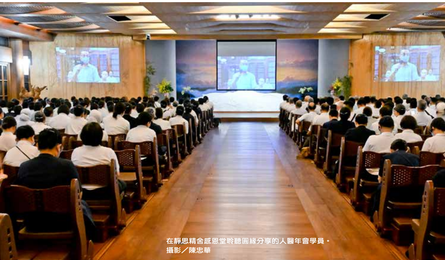
在靜思精舍感恩堂聆聽圓緣分享的人醫年會學員。

張醫師對於慈濟說出兩個結論：「第一是公私分明，第二是默默行善。」義診時間，慈濟的師父及志工不敢來看病，不敢用到慈濟的藥，公私分明，分得很