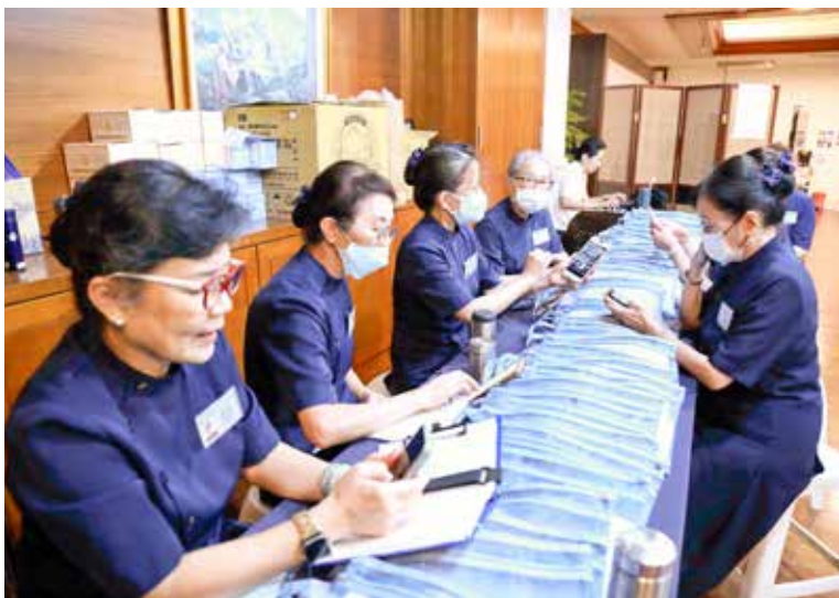
行政隊輔組整理學員袋並一一核對資料。