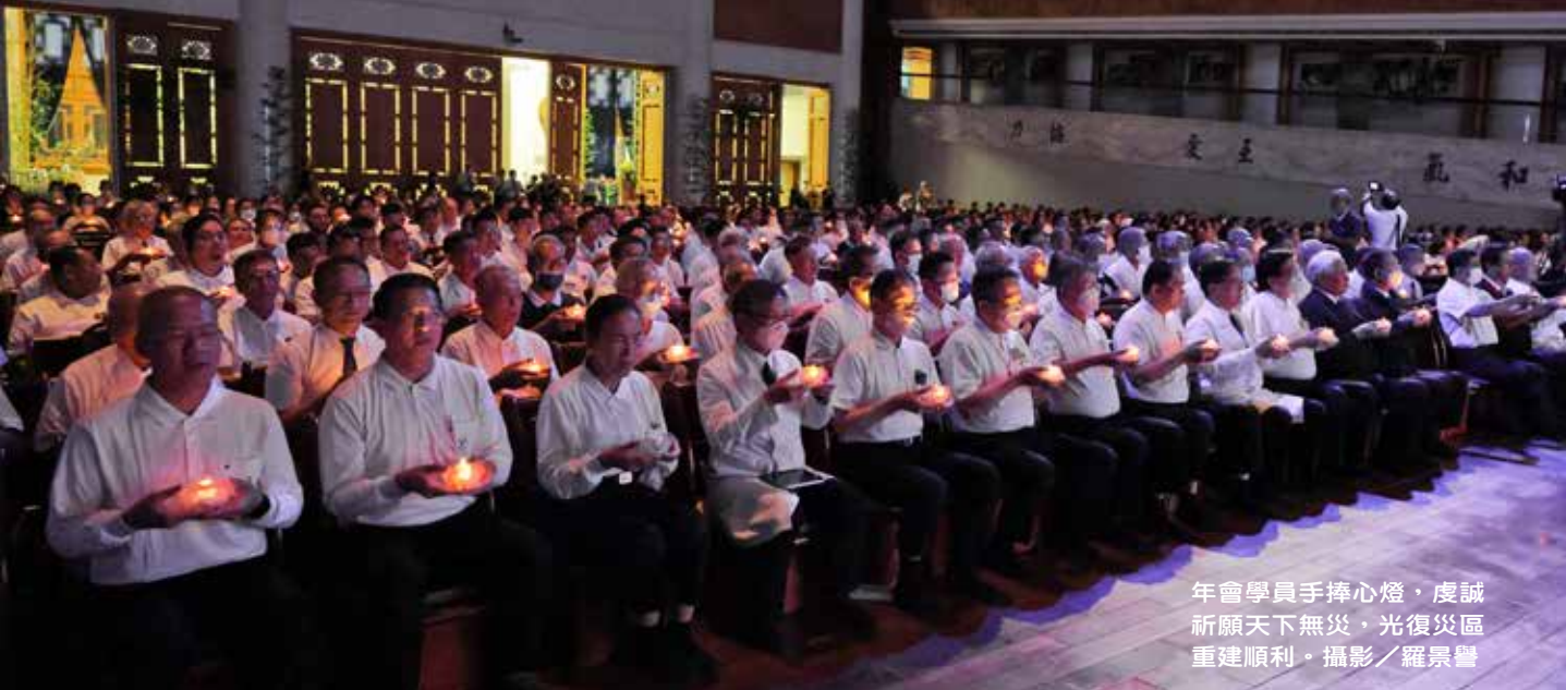
年會學員手捧心燈，虔誠祈願天下無災，光復災區重建順利。

加烤燈，甚至醫療隊的護理人員擁抱著阿嬤，用自己身上的溫度讓阿嬤體溫能夠增加……」