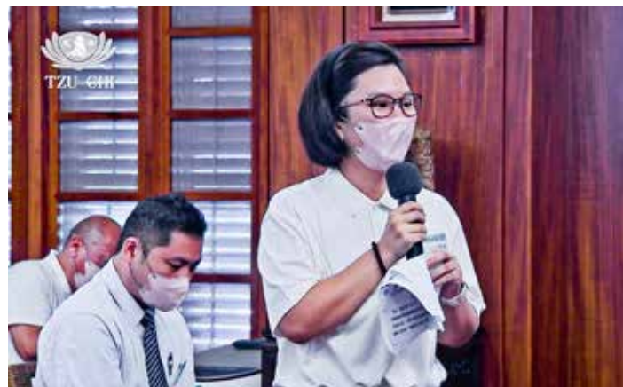
菲律賓喬安娜醫師以流利華語分享，感恩慈濟家庭的溫暖大愛。