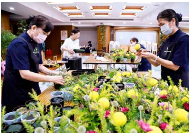
花藝布置組以花材呈現月圓人圓的景致。

人事組汪育如說明功能組的工作人員總共有三百四十位，幾乎是一比一的比例來照顧所有學員；外語隊要負責英文、印度文、越南語、西班牙語四國的語言翻譯。越南、美國、菲律賓的學員在營隊結束後會參訪台北慈院與內湖環保站；還有，伊斯蘭教一