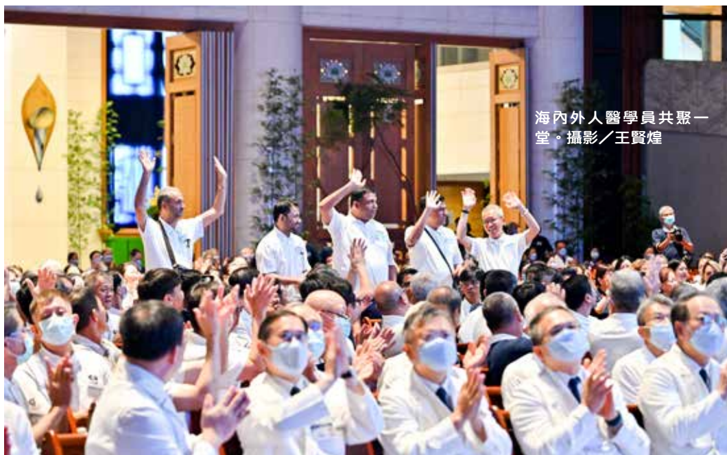
海內外人醫學員共聚一堂。