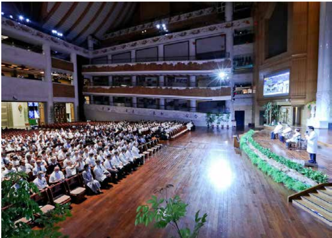
學員專注聆聽臺灣四大院區院長分享。