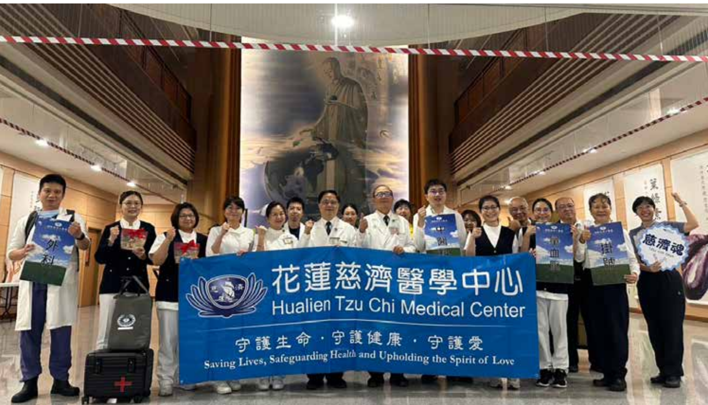
花蓮慈濟醫院駐診醫療隊於九月二十五日上午七點整隊出發光復鄉。