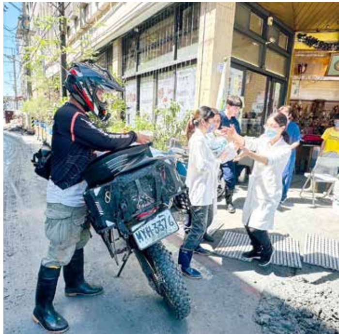
災區道路車輛難行，醫療站急需物資時，感謝越野車車友群伸出援手，為傷患爭取寶貴時間。