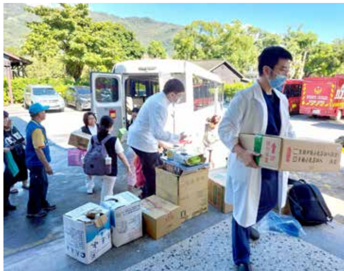
花蓮慈院醫療隊抵達光復糖廠醫療站，為鄉親帶來急需的醫療資源。

患後，可能有外傷或接觸汙水造成的感染問題，準備眼藥水、外用抗生素藥膏、痠痛藥膏、破傷風藥物、內用抗生