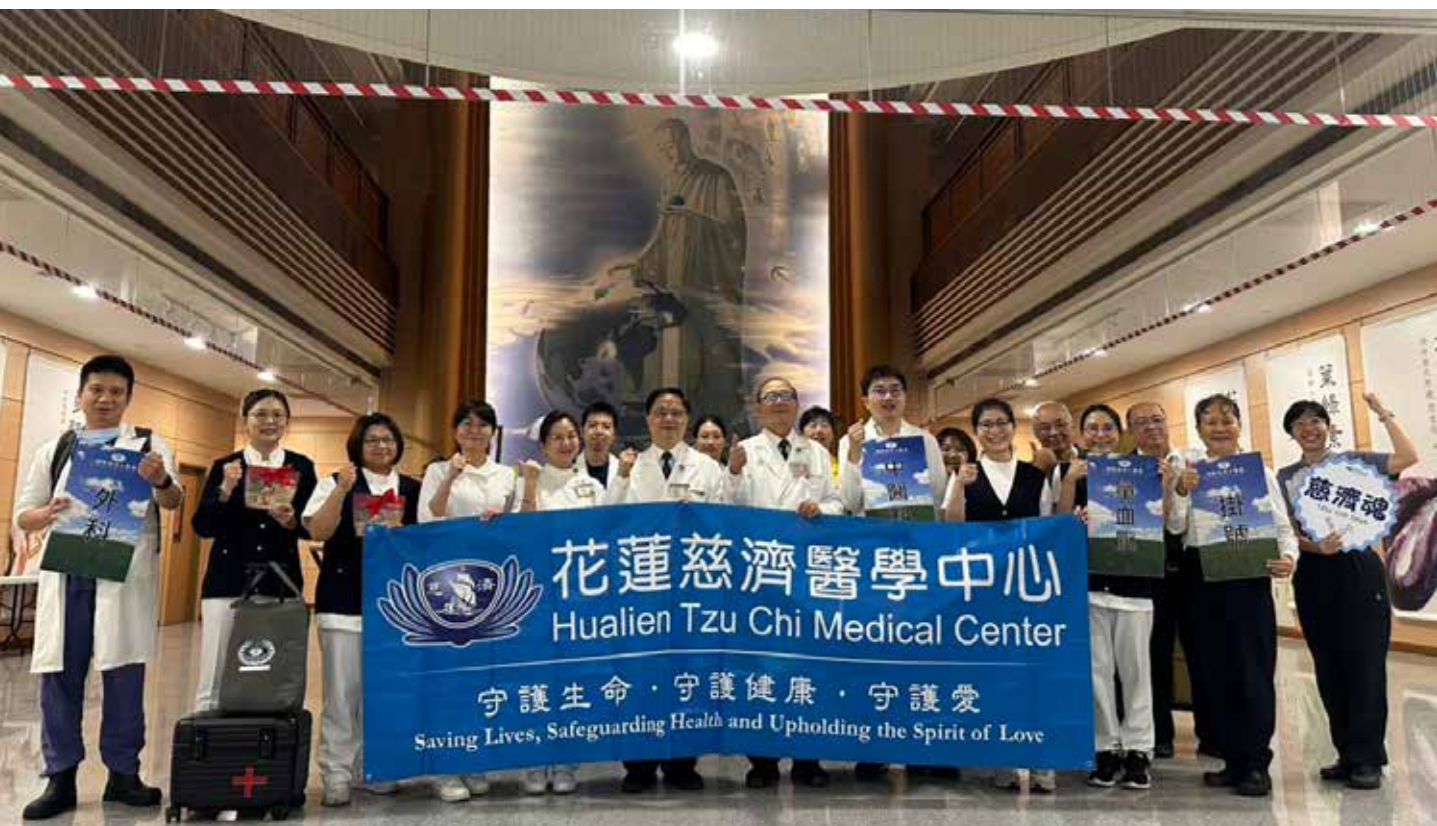
花蓮慈濟醫院駐診醫療隊於九月二十五日上午七點整隊出發光復鄉。