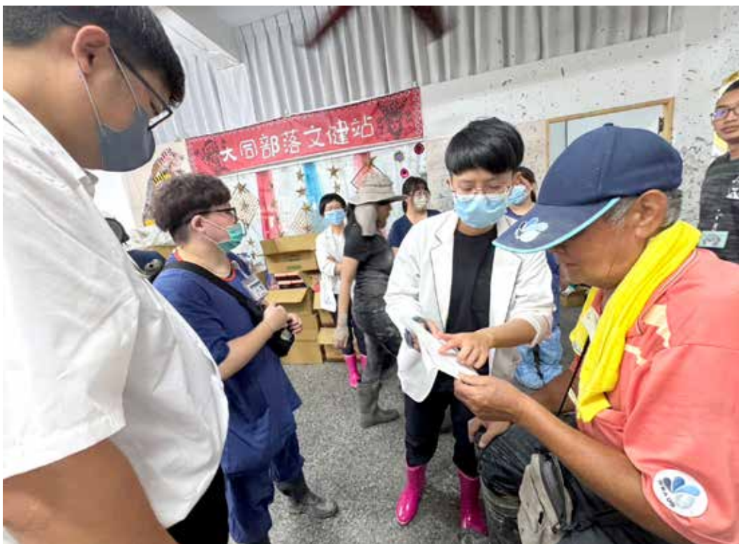
花蓮慈院醫療隊以機動巡迴徒步進入交通仍受限的大同村，為五天沒吃高血壓、糖尿病藥物的村長帶來即時的診治。

林欣榮院長表示，東部醫護人力招募不易，能在第一時間組成醫療隊，關鍵在於花蓮慈院有多次海內外救災義診的經驗，以及與東區慈濟人醫會多年維持每月偏鄉義診的傳統，在災害發生時便能很快啟動。以光復鄉為例，醫療站安排多科醫師進駐，並設置護理組及行政組組長，讓臨床醫療、護理照護與行政工作分工明確，不論是回應民眾需求、輪班交接、後勤調動或配合政府指揮協調，每個環節都有專責窗口。