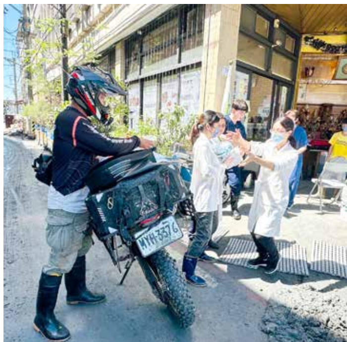
災區道路車輛難行，醫療站急需物資時，感謝越野車車友群伸出援手，為傷患爭取寶貴時間。