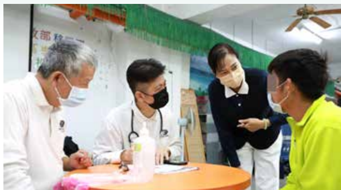
彰化慈濟人醫會醫護藥師會同埤頭、田中兩區志工共約八十人團隊，十二月二十八日前往南投收容所進行義診服務。圖為翻譯志工協助醫病溝通。

定期的義診服務，對人醫志工來說是常態型的付出，但對收容人而言就如同即時雨。那一點一滴的耐心問候與細心照護，總能讓他們深鎖的眉頭，短暫的鬆開。