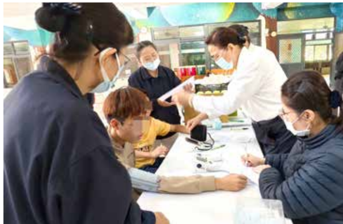
就診孩童報到後，志工先進行測量血壓及額溫等基礎檢查。攝影／黃南陽

童大多有多重身心障礙，外出就醫極為不易，透過義診，能幫助即早發現並治療孩子的健康問題。」陳綢阿嬤社會福