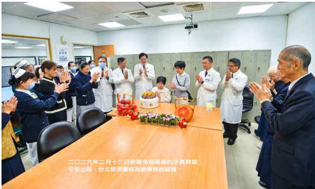
二〇二六年二月十二日脫離免疫風暴的小真終能平安出院，台北慈濟醫院為她舉辦祝福會。

幾天後清晨，一聲巨響打破家中寧靜。小真在浴室突然跌倒，家人趕緊將她送往鄰近醫院急診，初步檢查未見明顯異常，返家觀察；然而，就在隔天，她開始意識混亂、答非所問，連自己的名字都說不清楚，再次緊急就醫。腦部核磁共振顯示廣泛性發炎病灶，當時隨即被收治入院，後續經腰椎穿刺與中樞神經病原體檢測，確診感染禽分枝