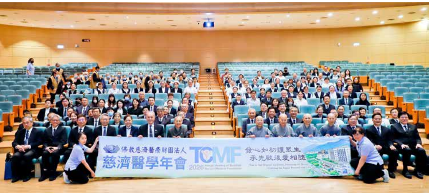
為期七天的慈濟醫學年會，於三月八日舉辦大會典禮，慈濟醫療志業、教育志業等同仁、師長齊聚一堂。攝影／謝自富