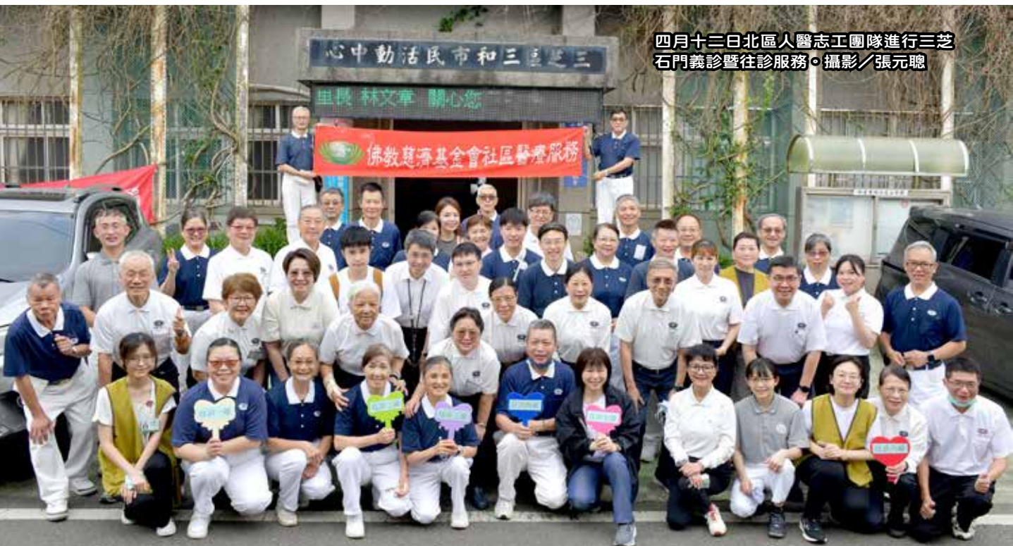
四月十三日北區人醫志工團隊進行三芝石門義診暨往診服務。